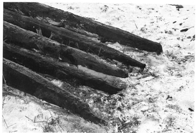
Abb. 2: Aegerten – Schwadernaustrasse 1972. Spitzen der ausgezogenen Eichenpfähle.