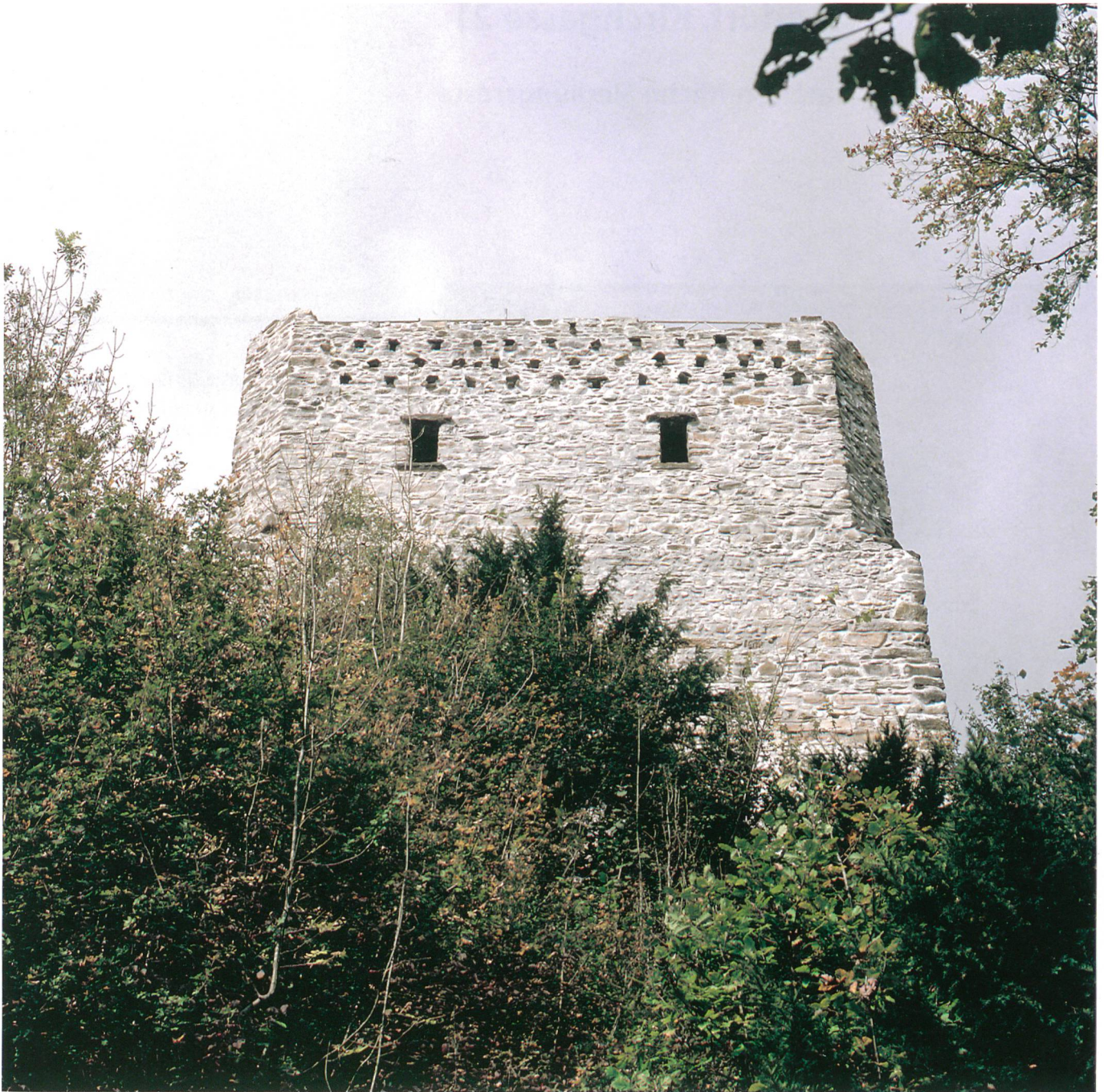
Abb. 5: Ringgenberg, Burg- ruine. Südfassade mit Brut- nischen und Fenstern des Festsaa's. Deutlich ist die Abschrägung der Ecken am oberen Turmteil sichtbar.