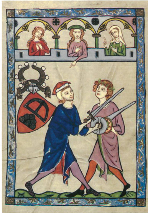
Abb. 2: Minnesänger Johannes von Ringgenberg. Autorenbild in der Manesischen Liederhandschrift, Universitätsbibliothek Heidelberg, fol. 190v.

Die von einer systematischen Planaufnahme und archäologischen Bauuntersuchung begleiteten Konservierungsarbeiten der Jahre 2006 und 2007 erlauben es, die Baugeschichte der Burg etwas differenzierter darzustellen (Abb. 3). Eine Burgenbauphase vor 1230 ist unwahrscheinlich, die Nutzung des Burghügels im Frühmittelalter jedoch durch das von Frutiger dokumentierte Steinkistengrab gesichert. Die für die späte Bronzezeit geltend gemachten Funde sind mittlerweile verschollen.