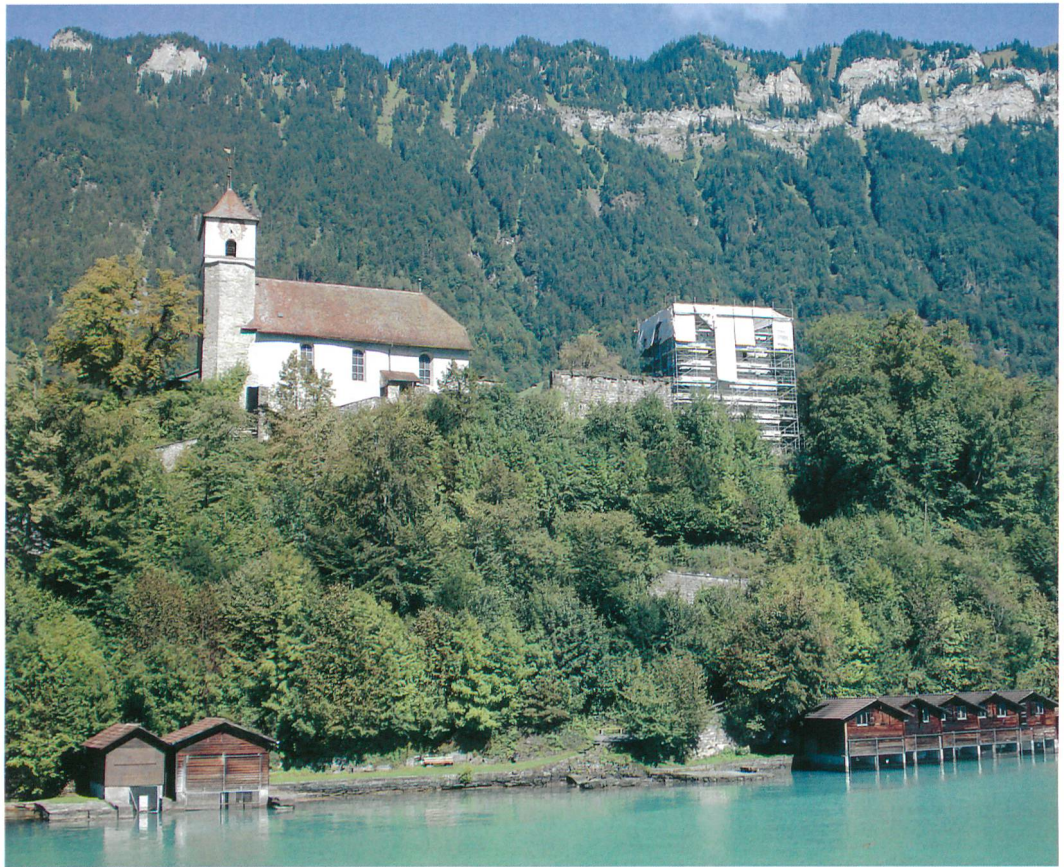
Abb. 1: Ringgenberg, Burgruine. Übersicht vom See während der Turmsanierung.