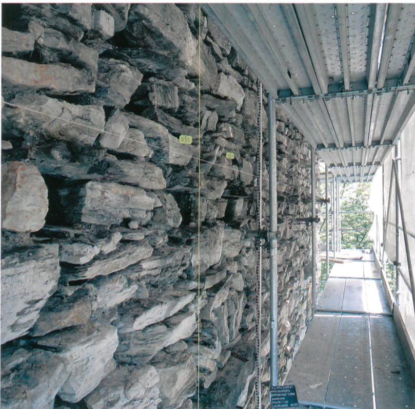
Abb. 4: Ringgenberg, Burg- ruine. Südfassade des Turms mit Brutnischen im noch unverputzten Zustand.

Unter Ausnützung der Ringmauern erfolgte 1670/71 der Einbau der heutigen Kirche. Einzig das östliche Drittel der Südmauer und die Ostmauer der Kirche mussten neu errichtet werden. Der Innenhof wurde nach dem Kirchenbau als Friedhof genutzt und hat deshalb ein 1,50 bis 2 m höheres Bodenniveau als ursprünglich.