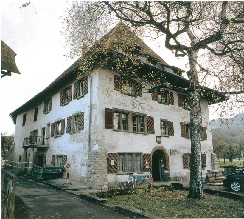
Abb. 1: Steffisburg, Höchhus. Das grosse Höchhus im Zustand kurz vor den Restaurierungsarbeiten.