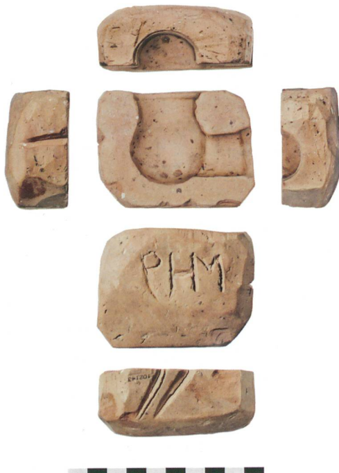
Abb. 5: Steffisburg, Höchhus. Keramischer Model für die Herstellung tönerner Pfeifenköpfe. M 1:2.

anschluss. Dieser war zum einen Erschliessungszone mit einer hölzernen Wendeltreppe und diente zum zweiten als Küchenbereich. Von dieser Halle aus konnte man im ersten Obergeschoss einen sich über anderthalb Stockwerke erstreckenden Festsaal im nordöstlichen Viertel betreten, während sich im südöstlichen Viertel die Oekonomie- bzw. Scheunenräume befanden.