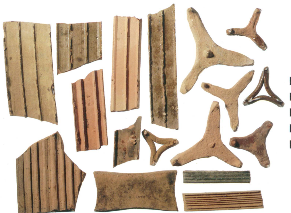
Abb. 6: Steffisburg, Höchhus. Brennhilfen aus der Einfüllung des Töpferofens nach Aufgabe der Töpferei.

Dieser Umbau wirft wiederum ein Schlaglicht auf das Phänomen des sozialen Aufstiegs im Alten Bern. Nachdem die Adelsburg im frühen 15. Jahrhundert von stadtbergnischen Aufsteigern übernommen und ein erstes Mal stilgemäss erneuert worden war, kam nun die einheimische ländliche Oberschicht in Gestalt von Peter Surer in den Besitz des prestigeträchtigen Gebäudes, der es ebenfalls umgehend – noch bevor er es gekauft hatte – im Stil der Zeit ausbaute.