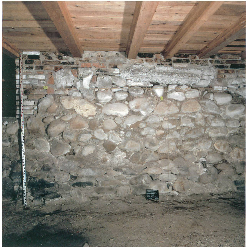
Abb. 3: Steffisburg, Höchhus. Die Reste der Ringmauer des 13. Jahrhunderts.

Diese Umgestaltung spiegelt die sozialgeschichtlichen Veränderungen, die sich im spätgotischen Bern abspielten: Die Matter waren eine typische Stadtberner Aufsteigerfamilie dieser Zeit. Ursprünglich wohl einfache Gerber, waren sie durch Handel zu grossem Reichtum gekommen und erscheinen seit der Zeit um 1400 als Ratherren, Schultheissen in Bern und Thun und Offiziere. Zusammen mit den Tschachtlan, von Ringoltingen und Diesbach gehörten sie im 15. Jahrhundert zur burgerlichen Führungsschicht Berns. Ihren Aufstieg