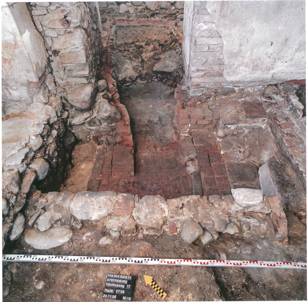
Abb. 4: Steffisburg, Höchhus. Reste eines Töpferofens der ersten Hälfte des 19. Jahrhunderts.