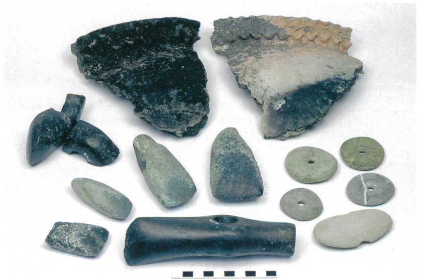
Abb. 3: Sutz-Lattrigen, Rütte. Eine Auswahl von Funden aus den Aufsammlungen der Tauchequipe während verschiedener Tauchgänge.