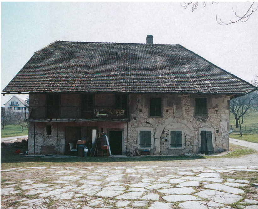
Abb. 1: Sutz-Lattrigen, Ziegelhütte. Der bauliche Zustand des alten Ländtheuses im Jahr 2007. Ansicht von Norden.

Unmittelbar am Ufer des Bieler Sees steht das Ländtheaus von Sutz-Lattrigen (Abb. 1 und 2). Es wurde, nach Jahren des Leerstandes, im Jahr 2007 saniert und einer neuen Nutzung zugeführt. Nach ersten Voruntersuchungen im Jahr 1999 führte der Archäologische Dienst des Kantons Bern seit Anfang 2007 zusammen mit der kantonalen Denkmalpflege archäologische und bauhistorische Untersuchungen durch. Ziel war die Dokumentation der vielfältigen Nutzungsgeschichte des Hauses, die sich sowohl im Boden als auch im aufgehenden Mauerwerk ablesen liess.