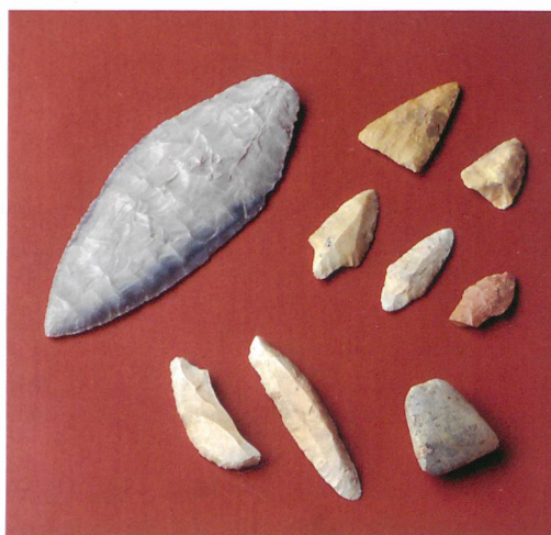
Abb. 3: Vergleichsfunde aus der Schweiz. Opfikon ZH, Wallisellerstrasse. Beigaben aus dem Steinkistengrab von 1931.

werden. Das Steinkistengrab von Opfikon ZH wird ebenfalls in die zweite Hälfte des 3. Jahrtausends datiert. Die Beigaben sprechen für eine schnurkeramische Zeitstellung, der Totenritus, mit einer Bestattung in gestreckter Rückenlage, könnte jedoch auch auf ein spätes Horgen deuten. 5