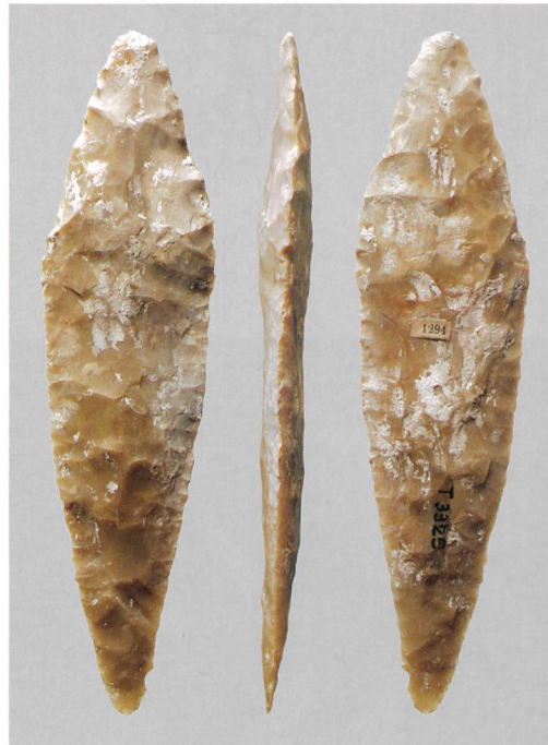
Abb. 1: Marin-Préfargier - La Tène. Ein beidseitig facettierter Silexdolch aus dem Bestand des Museums Schwab, Biel. M. 1:2.

Der beidseitig facettierte Dolch (Abb. 1) weist im oberen Drittel eine nur schwach abgesetzte bis leicht einziehende Heftplatte oder Griffzunge auf. Der Schneidenbereich des Dolchs wurde sorgfältig mit feinen Retuschen geformt, während die Heftplatte deutlich weniger Sorgfalt erfuhr. Dieser Teil des Dolchs war im ursprünglichen Zustand nicht sichtbar, da er durch eine Schäftung aus organischem Material verdeckt war. Mit einer Länge von 164 mm erreicht der Dolch von La Tène eine beachtliche Grösse. Er ist beidseitig flächig retuschiert und weist dadurch einen abgeflacht-linsenförmigen Querschnitt auf. Er unterscheidet sich damit von ähnlich grossen, einseitig retuschierten Grand-Pressigny-Dolchen, die einen trapezförmigen Querschnitt aufweisen.