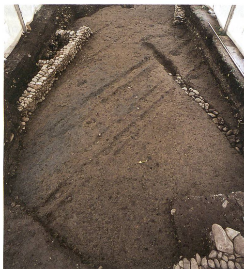
Abb. 3: Hasle bei Burgdorf, Kirchmatte. Die Karrenspuren der mittelalterlichen Landstrasse.

Unser archäologischer Befund lässt die Vermutung zu, dass diese untere Strasse möglicherweise wesentlich älter war. Wahrscheinlich führte diese Strasse, die sich heute nordöstlich von Hasle verzweigt und unter Umgehung des Dorfkerns direkt zur Brücke über die Emme geht, ursprünglich unmittelbar an der Kirche vorbei – der archäologisch erfasste Wegabschnitt – und verzweigte sich dort: ein Zweig führte weiter den Talrand entlang, während der zweite die Talhangkante erklimmte und über Eichholz in Richtung Süden zog. Wahrscheinlich ist die heutige Quartierstrasse Kirchmatte, eine Sackgasse, der letzte Rest dieses Strassenastes, der auf der Siegfriedkarte noch als durchgehender Feldweg zu erkennen ist (vgl. Abb. 2).