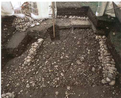
Abb. 4: Hasle bei Burgdorf, Kirchmatte. Die Sockelmauerchen und die Schotterplanie des grossen Gebäudes.

Wir haben also ein stattliches Gebäude auf quadratischem Grundriss, wahrscheinlich zweigeschossig, das direkt neben dem Kirchhof stand und auf die eine Hauptstrasse von Hasle hin ausgerichtet war. Ausserdem war das Gebäude prominent bzw. sein Bauherr mächtig genug, dass er es auf einen alten Strassenabschnitt setzen konnte, was eine Verlegung dieses Abschnittes zur Folge hatte.