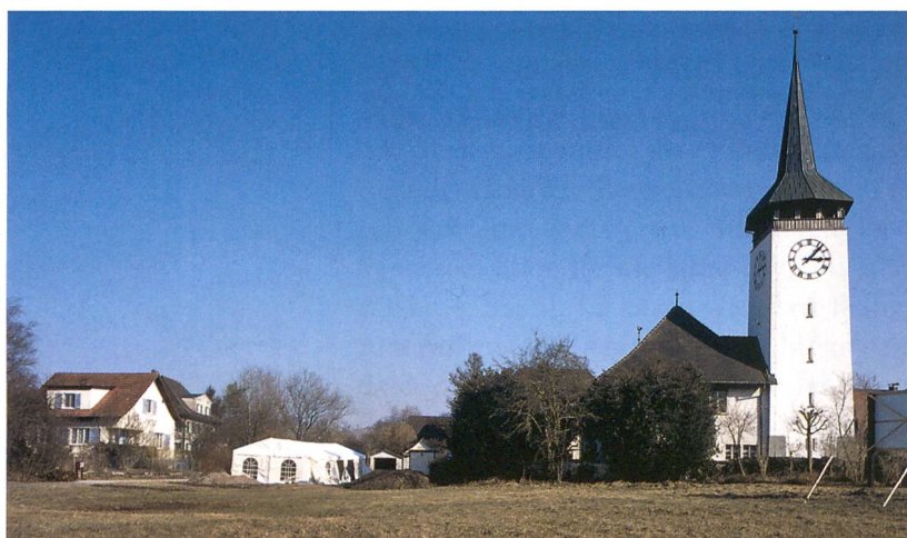
Abb. 1: Hasle bei Burgdorf, Kirchmatte. Übersicht über das Gelände. Rechts die Pfarrkirche, links das Grabungszelt.

Die Pfarrkirche steht im Zentrum des Dorfes, am südlichen Rand des Flusstales. Obwohl archäologische Ausgrabungen bisher fehlen, ist anzunehmen, dass sie eine Eigenkirchengründung des 11. oder 12. Jahrhunderts ist. Offenbar lag das Kirchenareal damals knapp ausserhalb der Hochwasserzone. Unmittelbar nördlich der Kirche muss die Kante der Schwemmebene gelegen haben. Die Kirchmatte nördlich davon lag bereits in der Emme-Aue. In der Grabung war das in Form von Schwemmsand- und Schwemmelhmschichten sichtbar, die den im Schnitt 50 cm unter dem heutigen Terrain anstehende Kiesschotter der Emme überlagerten. Nordwestlich des Grabungsgeländes, im Bereich der künftigen Hausparzellen, fand sich bei den archäologischen Sondierungen ein rund 20 cm starker, torfiger Feuchtbodenhumus, aus dem prähistorische Hölzer geborgen wer-