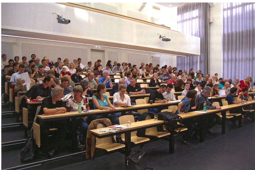
Abb. 1: Lenk, Schnidejoch. Internationales Symposium, Hörsaal A003 im UniS-Gebäude, Schanzeneckstrasse 1 der Universität Bern bot während eineinhalb Tagen ideale Bedingungen für Referenten und 140 Teilnehmer.