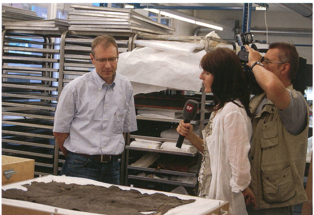
Abb. 5: Lenk, Schnidejoch. Internationales Symposium. SF DRS zu Besuch im Archäologischen Dienst. «Schweiz aktuell» sendete live aus den Räumen an der Brünnenstrasse 66. Die «Tagesschau» und «10 vor 10» berichteten ebenfalls über die archäologische Sensation aus dem Kanton Bern.

Die gemeinsame Medienmitteilung von OCCR und der Kommunikationsstelle des Kantons Bern KomBE zum Symposium wurde von zahlreichen Medien übernommen. Im Mittelpunkt stand dabei die Aussage, dass einzelne Funde von Lenk, Schnidejoch über 1000 Jahre älter sind als die bekannte Gletscherleiche («Ötzi») vom österreichisch-italienischen Tisenjoch. Die nationale Nachrichtenagentur swissinfo.ch verbreitete die Neuigkeit in sechs europäischen Sprachen sowie auf Arabisch, Japanisch und Chinesisch. Andere Nachrichtenagenturen griffen die Meldung auf und deshalb wurde weltweit über dieses Ergebnis der ersten wissenschaftlichen Auswertungen berichtet (Abb. 4). Im Web-Portal Google wurden zeitweise unter dem Begriff «Schnidejoch» über 13000 Einträge gefunden.