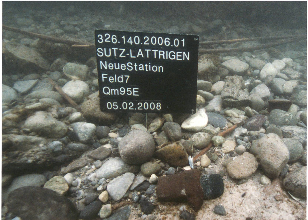
Abb. 4: Sutz-Lattrigen, Neue Station. Oberflächenfund einer in Hirschgeweih geschäfteten jungsteinzeitlichen Beilklinge.

In jenem Abschnitt der Ausgrabung, der vermutlich in das 33. oder 32. Jh. v. Chr. datiert werden kann, ist der Pfahlplan zu dicht, um schon vor der dendrochronologischen Auswertung Hausgrundrisse rekonstruieren zu können. Hingegen zeigt die Verwendung von starken Eichen an, dass hier mit Sicherheit Gebäude zu erwarten sind. Das erstaunlichste an dieser Dorfanlage ist eine mächtige, bis zu 7 m tiefe Umfriedung (vgl. Abb. 3), die mit den im Neolithikum üblichen Palisaden nichts mehr zu tun hat. Sie ist nahezu ausschliesslich aus Haselstangen aufgebaut und diese bilden vermutlich das innere Gerüst einer Verteidigungsanlage, wie sie ansonsten nur aus spätbronzezeitlichen Fundstellen bekannt sind. Beispiele