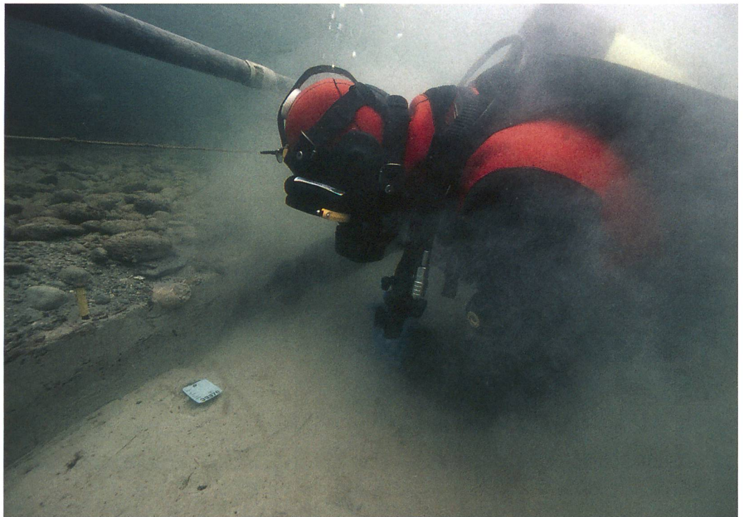
Abb. 1: Sutz-Lattrigen, Neue Station. Archäologie-Taucher bei der Arbeit.