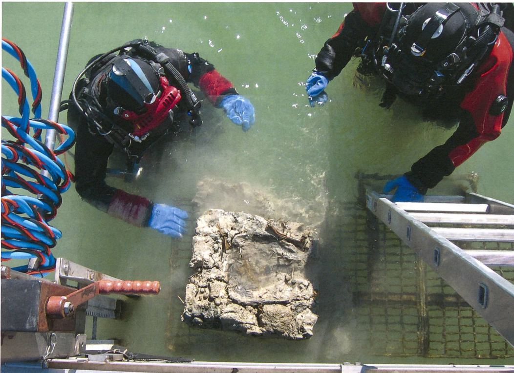
Abb. 5: Sutz-Lattrigen, Neue Station. Blockbergung eines Keramikgefäßes auf die Tauchplattform.

Die Untersuchungen in Sutz-Lattrigen, Neue Station, die auch wissenschaftlich bedeutendes Fundmaterial erbracht haben (Abb. 4 und 5) werden im Frühjahr 2009 abgeschlossen. Eine Fläche von etwa 800 m 2 im mittleren Abschnitt der Fundstelle wird nicht ausgegraben, da sie sich im Schutz eines Schilffeldes befindet und nach unserer Einschätzung nur einer geringen Erosion ausgesetzt ist. Deshalb kann vorerst auch auf Schutzmassnahmen und die Abdeckung mit Geotextil und Kies verzichtet werden. Zur weiteren Beobachtung der Situation werden in der Fläche Erosionsmarker installiert, die es erlauben die Erosion innerhalb eines Monitoring-Programms über die kommenden Jahre hinweg zu beobachten.