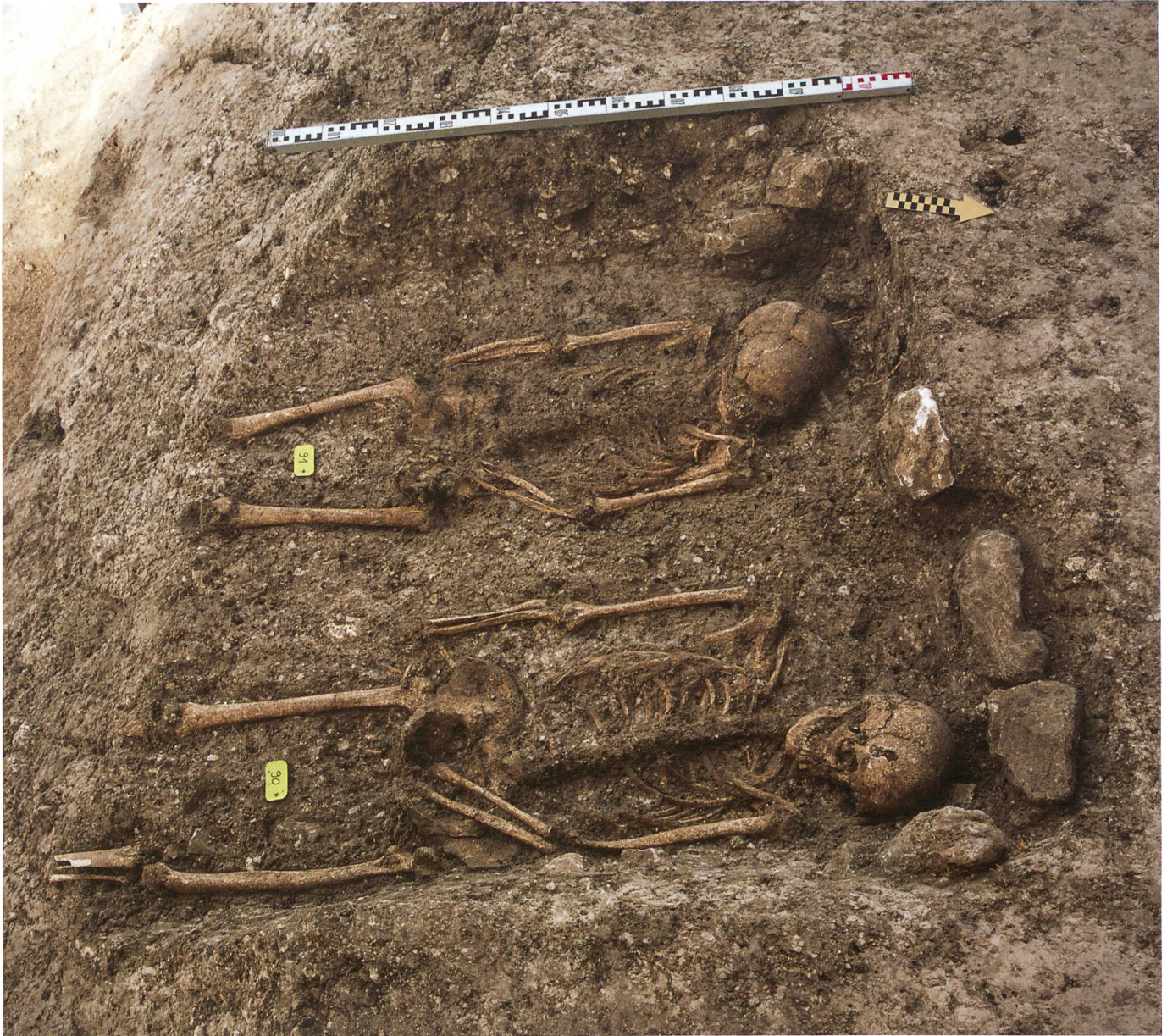
Fig. 5 : Tramelan, Crêt Georges Est : les deux tombes rapprochées T41 et T42 constituent un bel exemple de ces sépultures orientées nord-sud, majoritaires sur le site tramelot.