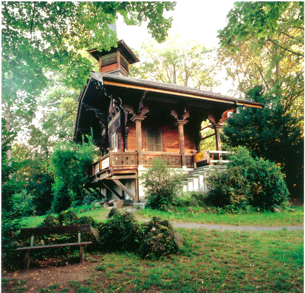
Abb. 1: Hilterfingen, Schloss Hünegg. Aktuelle Ansicht des Pavillons von Südwesten.

Ist die Zweckbestimmung des aktuellen Baus unmissverständlich zu erkennen – Aussichtspunkt und gewissermassen Ausflugsziel im Park – gab der ältere Unterbau baugeschichtliche Rätsel auf. Eine kurze Bauuntersuchung, die wir in Zusammenarbeit mit dem Architekten (Martin Saurer) und der Kantonalen Denkmalpflege (Randi Sigg-Gilstad) Mitte August 2009 durchführten, sollte Klarheit bringen. Dabei konnten wir uns auf verlässliche Planaufnahmen von Architekt Albrecht Spieler stützen.