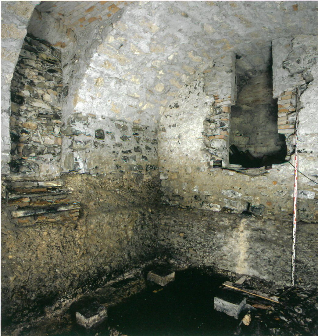
Abb. 4: Hilterfingen, Schloss Hünegg. Das Innere des Gewölbe- / Eiskellers nach Osten. Links der vermauerte originale Zugang in den barocken Gewölbekeller.