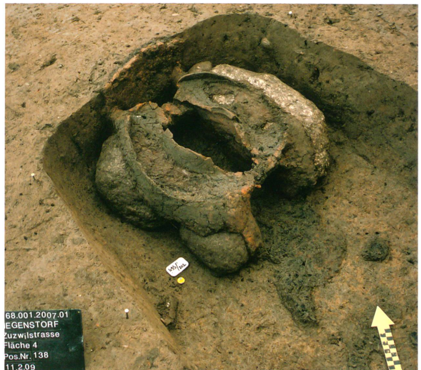
68.001.2007.01 JEGENSTORF Zuzwilstrasse Fläche 4 Pos.Nr. 138 11.2.09

Als Vorrats- oder Fassgrube ist wohl die kreisrunde Grube 253 anzusprechen, welche knapp 20 m südöstlich des Webkellers lag und einen Durchmesser von 1,7 m aufwies. Ein C14-Datum aus der Einfüllung datiert diese ebenfalls ins 11./12. Jahrhundert (Abb. 3). Einige grautonige Scherben bestätigen die mittelalterliche Datierung der Grubenfüllung. Je ein kleines neuzeitliches Glas- und Keramikfragment weisen aber auf neuzeitliche Störungen hin, wie sie in diesem Teil des Areals häufig anzutreffen sind.