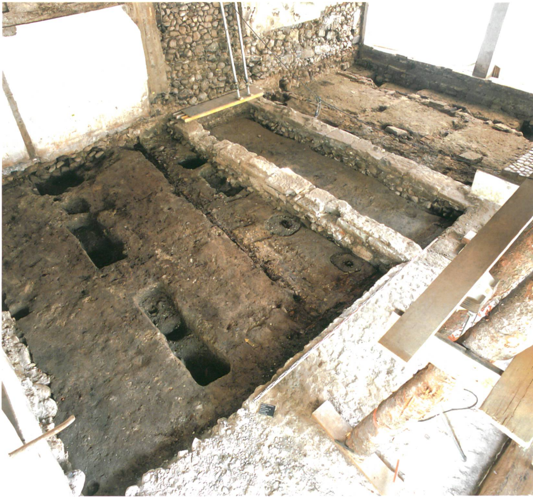
Abb. 8: Köniz, Schloss, Muhlernstrasse 15. In der Mitte der Zentralgang von dem aus die Pferde gefüttert werden konnten. Deutlich sind die Balkengruben der Pferdeboxen östlich und westlich des Ganges zu erkennen.

errichtet (107). Vier unterschiedlich breite Stützpeiler (9, 10, 11, 12), welche die Fusspfetten (7) des neuen Dachstuhls trugen, wurden an die alte Ringmauer gesetzt. Im Lauf des 20. Jahrhunderts wurden diverse Betonbauten erstellt und Backsteinmauern ersetzt. Zuletzt wurde das Gebäude nicht mehr als Rossstall benutzt, sondern diente als Lagerhaus für einen Antiquitätenhändler.