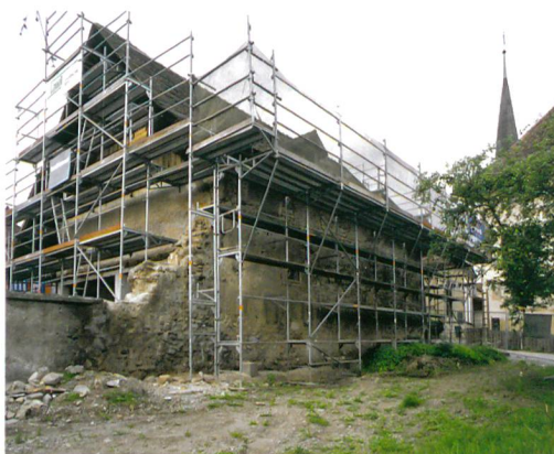
Abb. 2: Köniz, Schloss, Muhlernstrasse 15. Blick auf den Rossstall.

Das Schlossareal kann grob in drei Bereiche unterteilt werden, die bis ins 18./19. Jahrhundert auch separat ummauert waren: Erstens westseitig die Kirche mit dem Friedhof, zweitens nordseitig das eigentliche Schloss mit dem