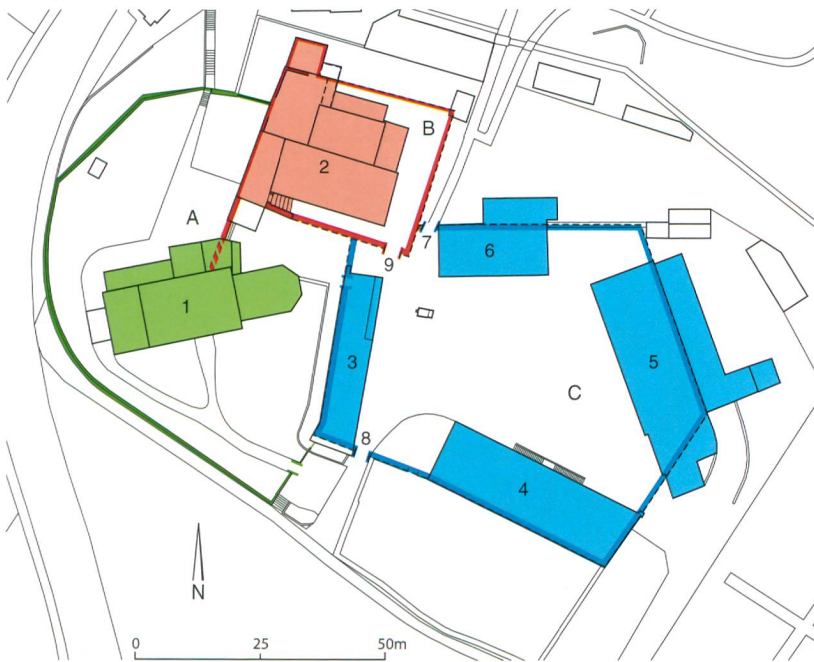
Abb. 1: Köniz, Schloss, Muhlernstrasse 15. Gesamtübersicht des Schlossareals. M. 1:1500.