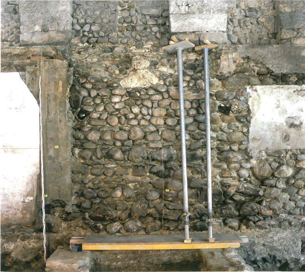
Abb. 5: Köniz, Schloss, Muh- lernstrasse 15. Detailan- sicht des mittelalterlichen Mauerwerks.