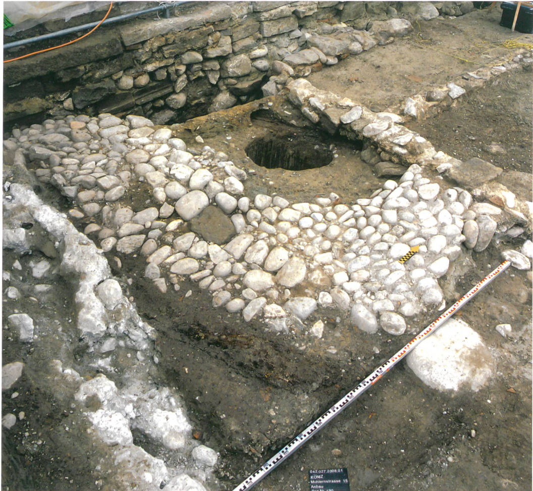
Abb. 7: Köniz, Schloss, Muhlernstrasse 15. Pflasterung und eingetieftes Regenwasserfass ausserhalb des Gebäudes des 18. Jahrhunderts.