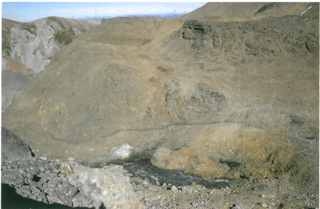
Abb. 1: Lenk, Schnidejoch. Die Fundstelle von oben. Übersicht nach NO. Unten rechts: Daniel von Rütte und Vermessungs-Stativ. In der Bildmitte: Fusspfad, der nach Süden (rechts) zur Passhöhe des Schnidejochs führt.

Die archäologischen Funde stammen aus einem kleinen Eisfeld an der Nordseite des Passes (Abb. 1). Das Gelände ist relativ flach und die Eismasse stagniert weitgehend. In den Jahren 2004 und 2005 schmolz das Eis massiv zurück und gab sehr viele Funde frei. Insgesamt wurden etwa 300 Objekte aus organischem Material, meist Holz oder Leder gefunden. Der starke Rückgang des Eises ist vermutlich auf den extrem warmen Sommer von 2003 zurückzuführen, der noch zwei Jahre nachwirkte. In den Jahren 2006 bis 2008 schmolz das Eis praktisch nicht mehr und es wurden nur noch