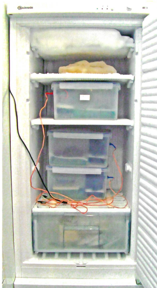
Fig. 2 : L'AFDbox, placée dans un congélateur, doit être sortie pour la pesée des objets en cours de séchage et le renouvellement du gel de silice.

Cette diversité reflète d'une part les conditions de travail : les restaurateurs explorent différentes possibilités en fonction des col-