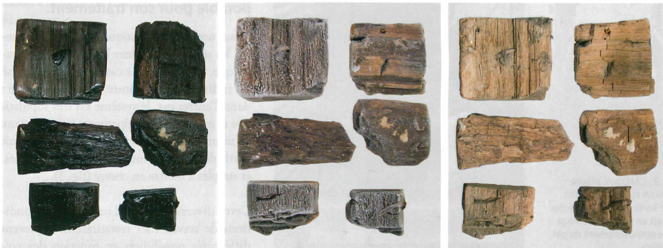
Fig. 1 : Échantillons de bois archéologiques gorgés d'eau, congelés, puis lyophilisés à la pression atmosphérique.

L'avancée du traitement est suivie par la pesée des objets et le traitement est arrêté lorsque leur poids devient stable. Dans certains