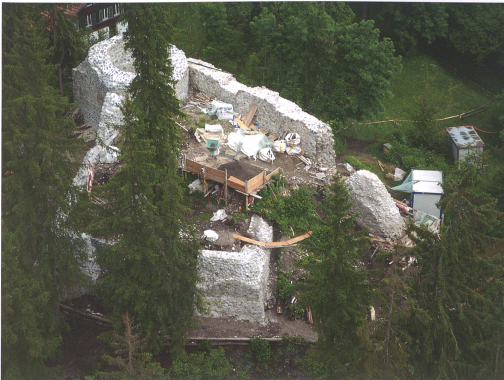
Abb. 4: Zweisimmen, Unterer Mannenberg. Die Burganlage während der Sanierung. Im Vordergrund der Sockel des Wohngebäudes und links davon der Steilhang zwischen oberem und unterem (weitgehend verschwundenem) Burghof, der von der steil abfallenden Ringmauer abgeschlossen wird. Im Hintergrund der Rundturm; darunter ist die Nordecke des mutmasslichen rechteckigen Turmes sichtbar, auf dem der jüngere Rundturm aufsitzt. Luftaufnahme, Blick von Südwesten.