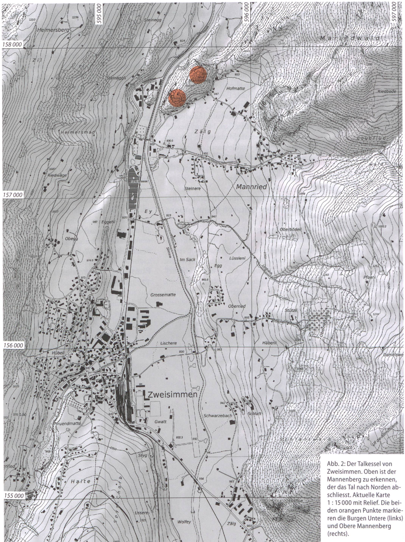
Abb. 2: Der Talkessel von Zweisimmen. Oben ist der Mannenberg zu erkennen, der das Tal nach Norden abschliesst. Aktuelle Karte 1 : 15 000 mit Relief. Die beiden orangen Punkte markieren die Burgen Untere (links) und Obere Mannenberg (rechts).