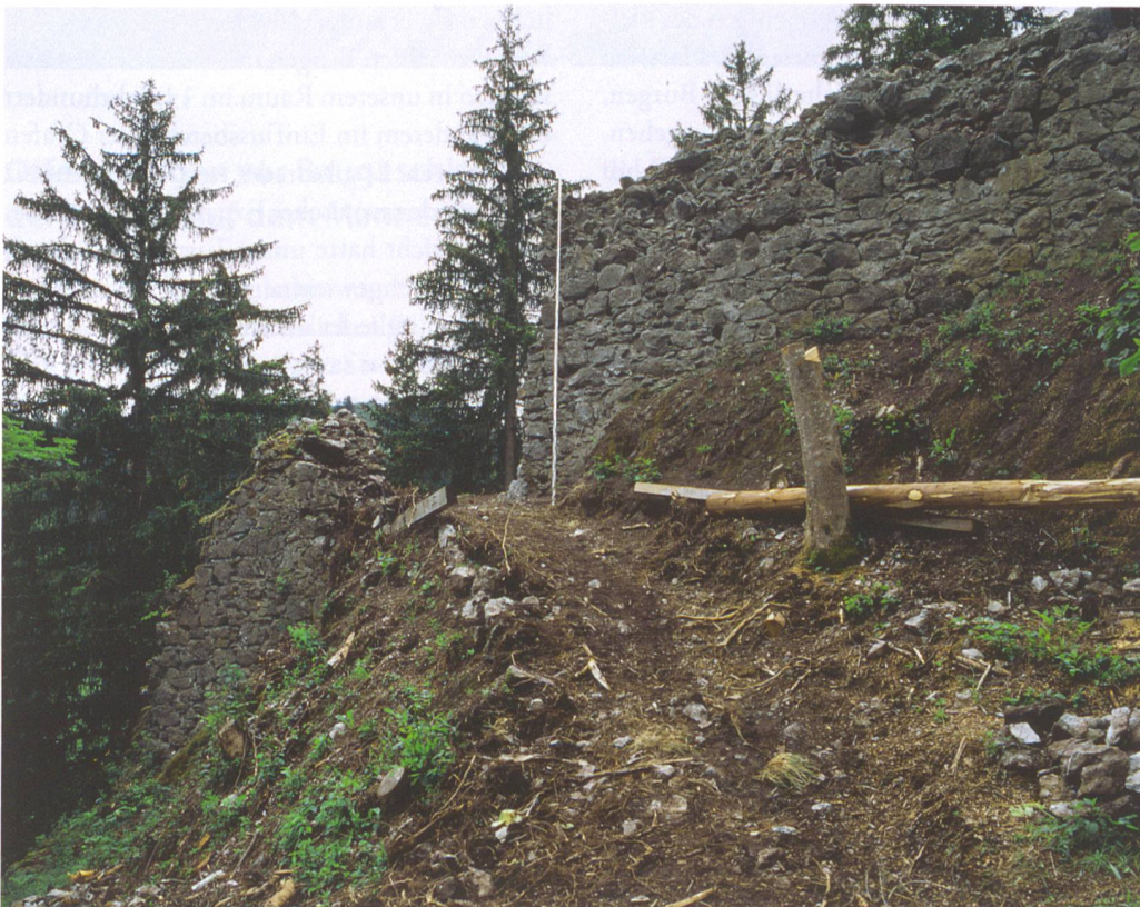
Abb. 6: Zweisimmen, Unterer Mannenberg. Die Reste des kleinen Portals in der östlichen Ringmauer; südlich davon fällt das Gelände steil ab, wie am Verlauf der Ringmauer gut sichtbar ist. Im Vordergrund die überwachsenen Reste der zum Portal führenden Rampe. Blick von Osten.

Im kleinen Burghof wurde die eine Seite eines Mauerzuges aufgedeckt, der mit einer Mauerstirn an der hofseitigen Fassadenmauer des Wohnbaus ansetzte und dann in einem Abstand von etwa 3 m mehr oder weniger parallel zur nördlichen Ringmauer verlief. Vermutlich handelt es sich um ein innen an die Ringmauer anlehndes Gebäude, welches die Lücke zwischen dem mutmasslichen Turm und dem Wohnbau schloss und vielleicht als Verbindungsbau interpretiert werden kann. Möglich wäre auch, dass dieser Verbindungsbau und der mutmassliche Turm Teile ein und desselben Gebäudes sind, das dann einen L-förmigen Grundriss aufgewiesen hätte.