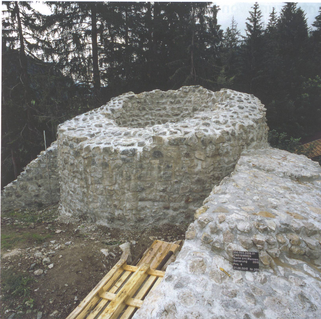
Abb. 7: Zweisimmen, Unterer Mannenberg. Der Rundturm der Phase II in restauriertem Zustand. Blick von Süden.