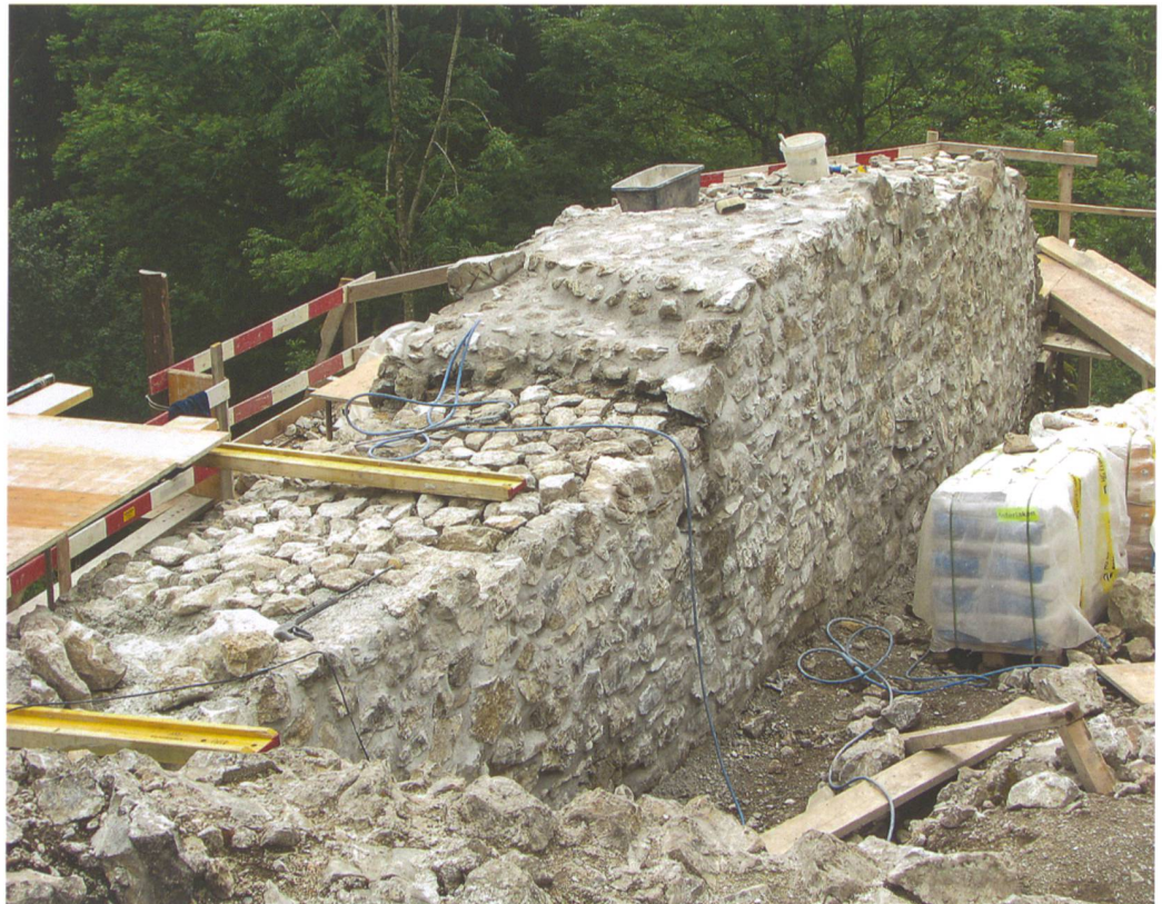
Abb. 5: Zweissimmen, Unterer Mannenberg. Wiederaufmauerung der obersten Mauerlagen. Blick auf die östliche Ringmauer von Norden.

Unmittelbar neben der Türnische setzt an der Innenseite der Ringmauer mit einem Winkel von 45° eine rund 1 Meter starke Mauer an, die auf die Südostecke des Wohnbaus zielte und so den oberen kleinen Burghof abschloss. Der Weg vom Aussentor ins Burginnere führte diese Mauer entlang. Da das Gelände unmittelbar südlich steil abfällt, hatte dieser Weg die Form einer aufgeschütteten Rampe, die mit einer talseitigen Stützmauer gesichert war. Auf dieser Rampe gelangte man wahrscheinlich durch ein weiteres Tor in den kleinen Burg-