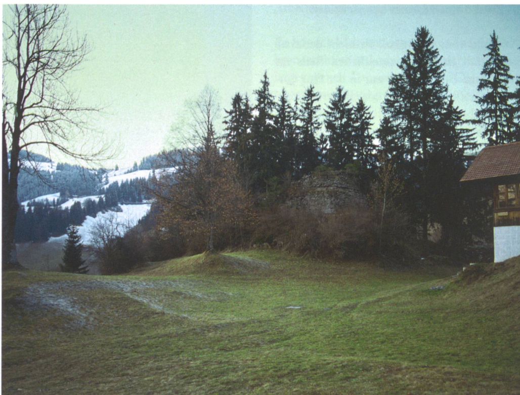
Abb. 1: Zweismmen, Unterer Mannenberg. Der überwachsene Burghügel mit den Resten des Rundturmes im Jahr 1985. Blick von Nordosten.

scheinen, die damaligen Inhaber der Herrschaft Mannenberg waren. Sie umfasste ursprünglich wohl nicht nur Mannenberg mit dem Dorf Zweismmen, sondern auch Blankenburg, Laubegg und Reichenstein. Bei der Ersterwähnung der Burgen Mannenberg in den Schriftquellen 1270 war der Besitzkomplex in den Händen der Freiherren von Raron und bestand aus dem Reichslehen Mannenberg, dem Eigengut Mannenberg-Reichenstein und der Herrschaft Laubegg. Im ersten Viertel des 14. Jahrhunderts gingen Mannenberg und Laubegg an die Freiherren von Strättlingen, die diese 1336 an die Grafen von Greyerz verkauften. Im Laupenkrieg 1339 stand Peter von Greyerz auf Seiten der Freiburger, was zu langwierigen Konflikten mit den Simmentaler Talleuten führte. Berner Truppen erstürmten