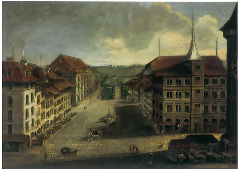
Abb. 8: Bern, Kornhausplatz/Theaterplatz/Markt-gasse. Ansicht des Kornhausplatzes in Bern, Ölgemälde von Johann Grimm (1675–1747), Burgergemeinde Bern. Im Vordergrund rechts das Gesellschaftshaus zu Pfistern.