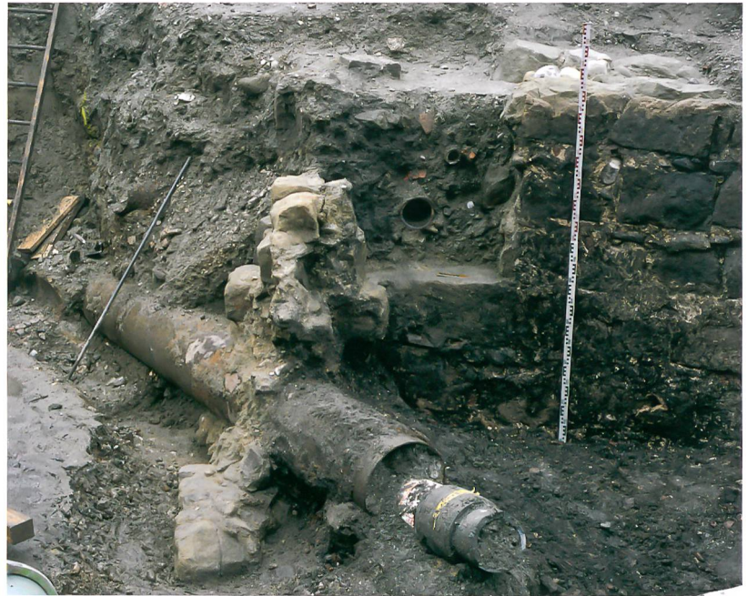
Abb. 2: Bern, Kornhausplatz/ Theaterplatz/ Marktgasse. Ansicht der Grabengegenmauer und des Ansatzes der Grabenbrücke von Osten (vgl. Abb. 1,1).

Der zur Zeit der Stadtgründung angelegte Stadtbach fliesst heute weitgehend unbemerkt unter den Gassen Berns und ist nur im Bereich der Gründungsstadt teilweise sichtbar. Auf der Baustelle war der von Osten nach Westen fließende Stadtbach jedoch über die ganze Fläche hin präsent (Abb. 1,2). Das Wasser wurde für die Baustelle ab Mitte der Marktgasse mit Hilfe von einer Pumpanlage hoch- und umgeleitet. In der Marktgasse war von einer mittelalterlichen Fassung nichts mehr zu erkennen, was nicht erstaunt, denn derartige Einrichtungen wurden durch das fließende Wasser stark beansprucht und mussten immer wieder saniert und erneuert werden. Zuletzt verlief der