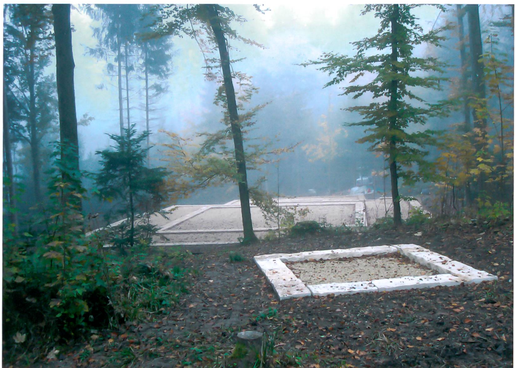
Abb. 1: Studen-Petinesca, Gumpboden, 2011. Nach der Instandstellung lädt der Tempelbezirk auf dem Gumpboden wieder zu Besuchen und zum Verweilen ein.

Wunsch des Archäologischen Dienstes des Kantons Bern einen Holzschlag durch. Planung, Finanzierung und Auftragsvergabe für die Neugestaltung nahmen danach noch einige Zeit in Anspruch. Doch im April 2011 konnte mit der Arbeit begonnen werden. Ziel war, sämtliche Gebäudegrundrisse und Teile der den heiligen Bezirk umschliessenden Temenosmauer durch Bodenmarkierungen sichtbar zu machen. Ein neues Netz von Fusswegen sollte durch die ursprünglichen Tore in der Umfriedung in die Anlage führen und innerhalb des Bezirks zu Rundgängen einladen (Abb. 2). Ein kleines Team des Archäologischen Dienstes führte sämtliche Erdarbeiten aus, und die Equipe eines Gartenbauunternehmens übernahm den Bau der Markierungen und Wege.