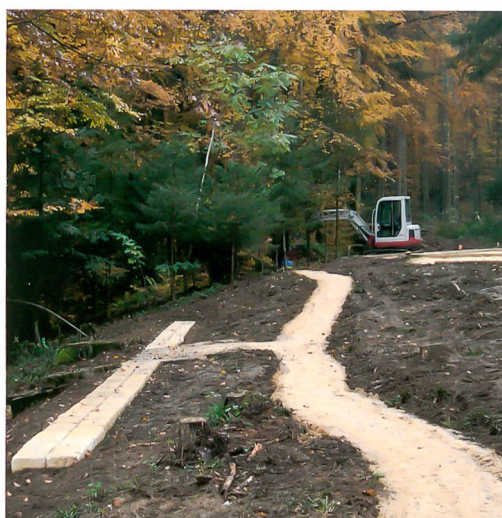
Abb. 4, Bild oben und in der Mitte: Studen-Petinesca, Gumpboden, 2011. Die Tempel 6 (im Vordergrund) und 4 vor und nach der Instandstellung. Was bis vor Kurzem von den einen als Idylle und von anderen als Schandfleck bezeichnet wurde, ist nun für die Besucher wieder sichtbar und verständlich.