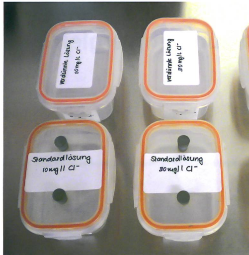
Abb. 1: Angesetzte Testbäder für die Chloridmessungen.

der Chloride in diesem Fall unbekannt wäre. Um die Ergebnisse der Messmethoden auf ihre Richtigkeit und Genauigkeit unter gleichen Bedingungen überprüfen zu können, wurden mehrere Natriumsulfitlösungen angesetzt und die Chloride anstatt über archäologische Eisenobjekte in Form einer Standardlösung in bestimmten Konzentrationen dazugegeben.