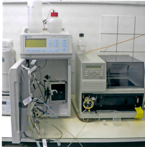
Abb. 5: Ionenchromatograph (DX-120; Fa. Dionex) im Labor der Universität Bern.

wurde durch einen angeschlossenen Computer in Form eines Chromatogramms dargestellt. Dabei wird das Detektorsignal in Abhängigkeit der Zeit in Kurvenform, ebenfalls peaks genannt, aufgezeichnet (Abb. 5).