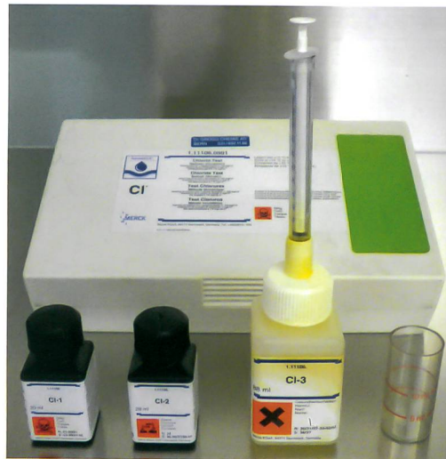
Abb. 2: Chlorid-Test Aqua-merck® der Firma Merck.

Für die kolorimetrische Messung wurde das Testkit Visicolor® ECO der Firma Macherey-Nagel verwendet, das hauptsächlich für die Messung in neutralen Gewässern eingesetzt wird. In dem Testkit sind Salpetersäure (19 %) und Quecksilberthiocyanat enthalten (Abb. 3).