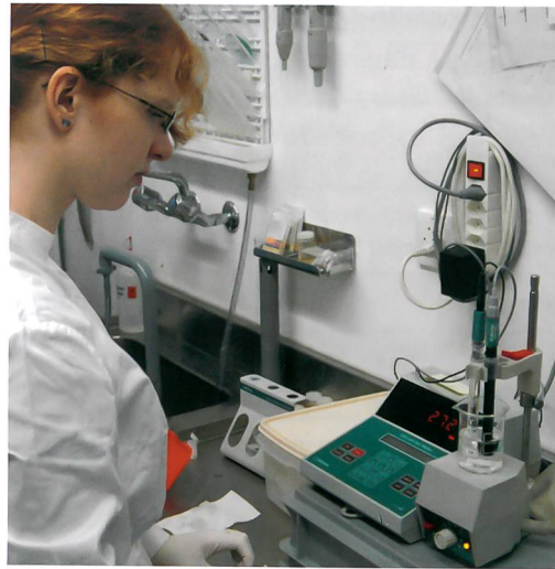
Abb. 4: Messung mit der ionensensitiven Elektrode im Labor in Fribourg.

Für die Messung wurde das Gerät zunächst mit Standardlösungen verschiedener Konzentrationen kalibriert. Anschliessend wurde die Probe durch einen Schleifeninjektor in das System eingebracht und an der Trennsäule gemessen. Das dort empfangene Signal