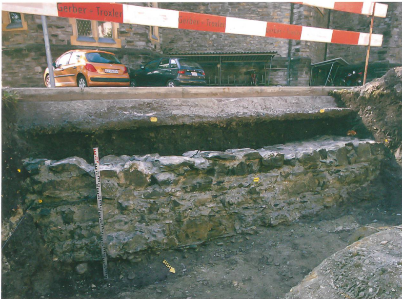
Abb. 3: Interlaken, Schloss. Fundament der Südfassade der Nonnenkirche des 14. Jahrhunderts. Blick nach Süden.

der Kirche einzelne Mauerzüge aufgedeckt, die zusammen mit Mauerfunden, die 1956 beim Bau des sogenannten Beatushauses zum Vorschein kamen, einen grösseren gemauerten Baukomplex von rund 30 mal 30 Metern annehmen lassen (Abb. 2.10). Es ist deshalb davon auszugehen, dass nordseitig der Kirche eine weitere Konventanlage stand, wohl die der Frauen, die ebenso wie diejenige der Männer mit gemauerten Gebäuden um einen Kreuzhof herum ausgestattet war.