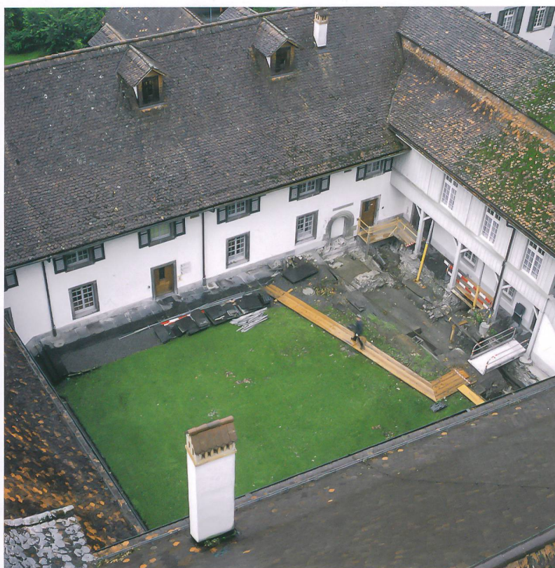
Abb. 1: Interlaken, Schloss. Blick in den spätgotischen Kreuzhof mit der Ausgrabung im Bereich des romanischen Konventflügels West. Im Hintergrund das Corps de Logis des barocken Landvogteischlosses. Blick nach Südwesten.

Das Augustiner-Chorherrenstift Unserer Lieben Frau in Interlaken wurde 1133 erstmals genannt, seit 1247 erscheinen Stiftsdamen in den Schriftquellen. Reiche Schenkungen und Käufe im 13. und 14. Jahrhundert machten das Doppelkloster zu einer der grössten Grundherrschaften im Berner Oberland. Es diente nach seiner Aufhebung im Jahr 1528 als Spital und Landvogteisitz und ist bis heute Regierungsstatthalteramt. Die ehemalige Klosterkirche beherbergt die evangelisch-reformierte Kirchgemeinde. Die Anlage weist heute einen Baubestand auf, der im Wesentlichen auf Um- und Ausbauten seit dem 15. Jahrhundert zurückgeht. Es gab in den letzten Jahrzehnten immer wieder punktuelle Bodeneingriffe und Bauuntersuchungen auf dem Schlossareal. Die archäologischen Untersuchungen der Jahre 2010 bis 2012, die durch umfang-