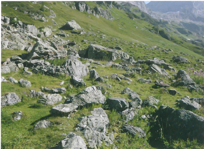
Abb. 2: Ein Blick auf die Wüstung Gadmen, Wendenlager 1 mit einer Schrägaufnahme vom Boden aus.

Veränderung der Motordrehzahl in alle Richtungen bewegen. Die Umsetzung der Steuerbefehle durch den Piloten an der Fernbedienung erfolgt am Fluggerät über eine zentrale Steuerplatine, auch Flight-Control genannt. Sie ist quasi das «Hirn» des Quadropters und neben dem Auswerten und Verarbeiten des Fernbedienungssignals und der Weitergabe der Befehle an die Motorregler für das Manövrieren zuständig. Hierfür sind verschiedene Sensoren wie Gyroscope, Beschleunigungssensoren oder ein Luftdrucksensor zur Höhenmessung und zur Stabilisierung der Flughöhe verbaut. Die Elektronik des für die Luftbilddaufnahmen verwendeten, selbst gebauten Quadropters stammt von der Firma Mikrokopter ( www.mikrokopter.de ).