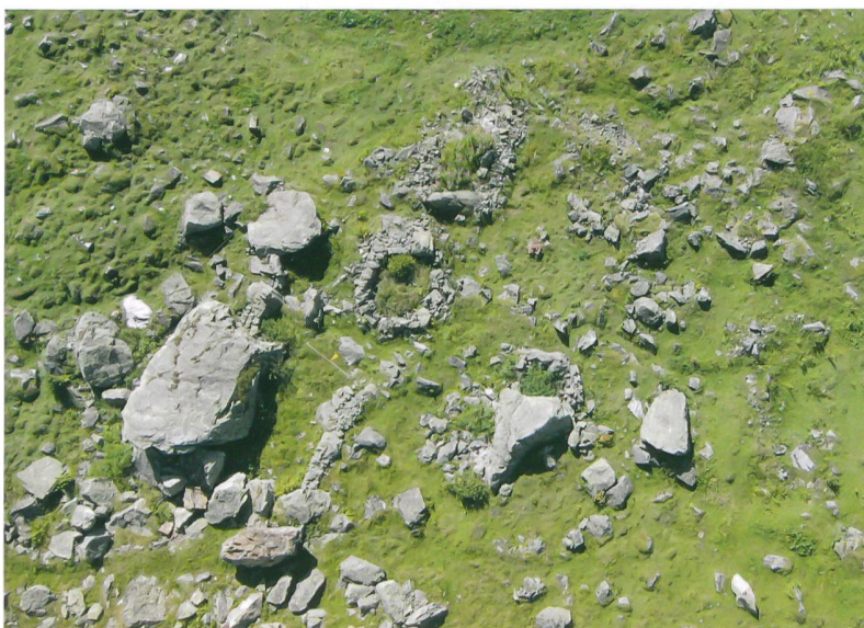
Abb. 3: Die Senkrechtaufnahme von Gadmen, Wendenlager 1 zeigt die Anordnung der einzelnen Strukturen.

Mithilfe der Sensoren wird nicht nur die Lage des Quadropters geregelt, sondern auch gleichzeitig der Kameraträger stabilisiert. Das heisst, die Kamera wird während des Flugs sowohl vertikal als auch horizontal voll automatisch in der Waage gehalten. Mit der eingesetzten Halterung lässt sich die Kamera zusätzlich um mehr als 90 Grad neigen, wodurch sowohl senkrechte als auch perspektivische Aufnahmen in einem Arbeitsgang möglich sind. Aufgrund des Gewichts kam eine lichtstarke Kompaktkamera (Canon Powershot S95) zum Einsatz. Zur Motivkontrolle wird das Live-Bild der Kamera per Funk auf einen kleinen Bildschirm an der Fernbedienung des Kopterpiloten gesendet. Das Bild kann sowohl einzeln von der Fernbedienung aus als auch automatisch in einem vorprogrammierbaren Intervall ausgelöst werden.