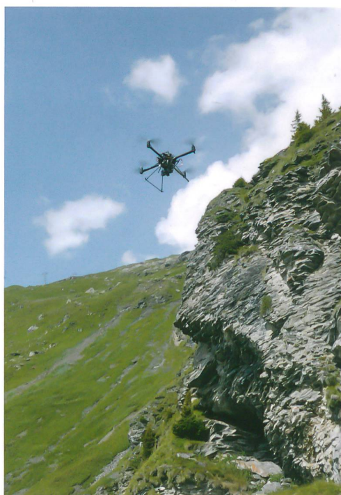
Abb. 1: Der Quadrocopter im Einsatz bei der Schweinebalm am Hasliberg.

Bei dem im Oberhasli eingesetzten Quadrocopter handelt es sich um ein funkferngesteuertes UAV (Unmanned Aerial Vehicle), auch «Drohne» genannt, mit vier Rotoren, die in einer Ebene angeordnet sind (Abb. 1). Die Propeller werden direkt von vier Elektromotoren angetrieben. Der Quadrocopter lässt sich durch