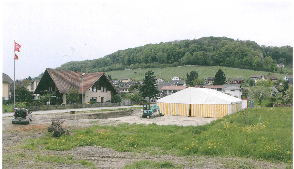
Abb. 2: Erlach, Im Bafert und Insstrasse 6. Die Grabung Im Bafert in der Flachzone am Fuss des Jolimont. Die Parzelle Insstrasse 6 liegt ausserhalb des linken Bildrandes. Blick nach Westen.

Bei den Sondierungen im nordwestlichen Teil des Baufeldes (Abb. 2) kamen Keramikscherben und Gruben zum Vorschein. In der gut zweimonatigen Grabung wurde eine grosse Anzahl Pfostengruben und Gruben sowie ein Graben