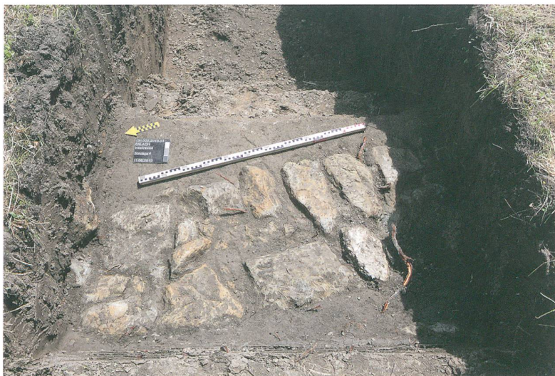
Abb. 5: Erlach, Im Bafert und Insstrasse 6. Ein römisches Mauerfundament in einer Sondierung an der Insstrasse 6. Blick nach Südosten.

Eine erste mittelbronzezeitliche Siedlung ist anhand einer beachtlichen Menge Keramikscherben nachgewiesen. Typologische Merkmale sprechen für eine Datierung in die Stufe Bz C (14. Jh. v. Chr.). Eine zweite Siedlungsphase deuten einige wenige latènezeitlich anmutende Scherben und ein C14-Datum an. Eine dritte, römische Nutzung belegen Ziegelfragmente und Scherben von Gefässkeramik. Die zahlreichen Pfostengruben und Gruben stellten sich aber nicht als römisch heraus. Eine Serie von sieben C14-Proben aus Pfostengruben und aus dem Graben datiert ins 11. bis 13. Jahrhundert. Wenige mittelalterliche Scherben bestätigen diese Datierung der letzten und vierten Siedlungsphase.