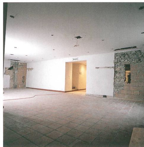
Abb. 3: Konolfingen, Schloss Hünigen. Sondierflächen auf der Nordseite des ältesten Kernbaus mit dem Gewölbekeller. Blick nach Süden.

Auskunft. Die enge Verbindung von Mühle und Herrnsitz ist seit dem Mittelalter häufig zu beobachten. Das Mahlen von Getreide gehörte ursprünglich zu den grundherrlichen Rechten, die an die jeweilige Herrschaft gebunden waren.