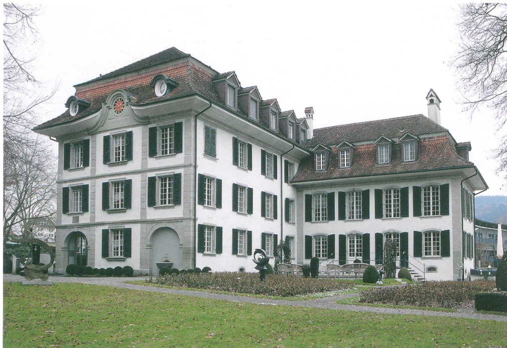
Abb. 1: Konolfingen, Schloss Hünigen. Südostansicht des Schlossbaus mit dem renaissancezeitlichen Treppenturm und dem Barockflügel.

2012 entschloss sich der neue Eigentümer von Schloss Hünigen dazu, das bestehende Hotel und Tagungszentrum zu modernisieren. Seit 1961 ist in Hünigen ein Schulungsort eingerichtet. Bereits 1976 und 1997/98 waren umfangreiche Umbauten erfolgt. Sie haben zu erheblichen Eingriffen in das national bedeutende Baudenkmal geführt. Der Wirtschaftskomplex mit der Mühle ist seitdem nahezu vollständig