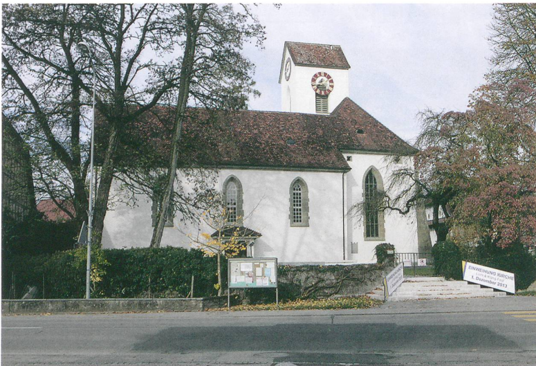
Abb. 1: Koppigen, Hauptstrasse 3. Ansicht der Kirche von Süden.

gehört zu einem Gutshof der mittleren Kaiserzeit im Umfeld der Kirche. Bereits 1926 und 1936 waren bei kleinen Sondierungen des damaligen Pfarrers römische Mauern und Ziegel entdeckt worden.