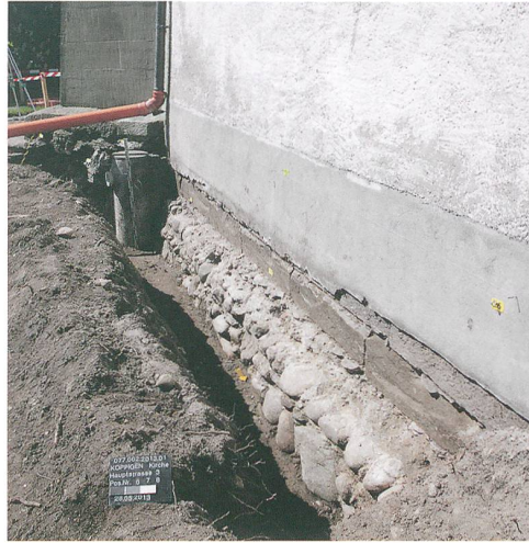
Abb. 3: Koppigen, Hauptstrasse 3. Ostseite des Hauptchores mit dem freigelegten Feldsteinfundament. Blick nach Süden.

Spiegelt sich diese Bausituation etwa in der Gründungssage der Kirche wider? Dort ist vom Streit beider Parteien die Rede. Thorberger und Koppiger konnten sich demnach nicht auf einen Bauplatz einigen. Die einen wollten die Kirche bei der ehemaligen Burgstelle errichten, die anderen bevorzugten einen Neubau im «Ruinenfeld des Römerturms», wie es heisst. Mehrfach legte man den Grundstein auf der Burg, doch wie von Geisterhand gelangte dieser auf das Ruinenfeld zurück. So fiel der Sage nach die Wahl schliesslich auf diesen Bauplatz im Dorf. Wenngleich die Sage gewiss nicht wörtlich zu nehmen ist, so verbirgt sich darin ein wahrer Kern. Immer wieder ist in den Schriftquellen vom Streit beider Parteien zu lesen, so etwa um 1417, als umfangreiche Baumassnahmen stattfanden.