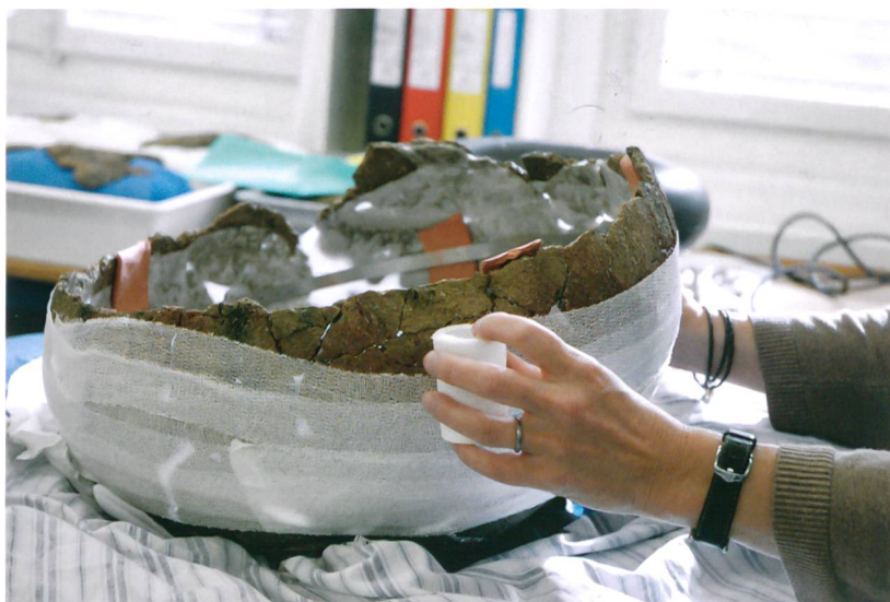
Abb. 5: Attiswil, Wiesenweg 15/17. Das mit selbsthaftender Binde umwickelte Gefäss, bevor es gedreht wird.

ben, was den extrem offenen Winkel des Unterteils erklären könnte. Da das Gefäss vermutlich zur kühlen Lagerung von Speisen gedient hat und deshalb in den Boden eingegraben war, war es bereits bei seinem Gebrauch gestützt (Ramstein 2014, S. 59). Bei diesem instabilen Bodenteil musste das anfängliche Konzept, nämlich das Gefäss vollständig aufzubauen, überdacht werden. Auch wurde das Objekt für die Zusammensetzung umgedreht und von oben nach unten aufgebaut (Abb. 3).