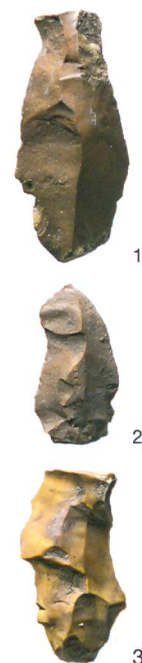
Abb. 3: Gampelen, Rundi. Auswahl von Funden aus den Sondierungen. 1 Klingenfragment; 2 und 3 Klinge. M. 1:1.

Radiokarbonproben aus den höchsten erhaltenen Seesedimenten datieren ins späte 7. respektive in die zweite Hälfte des 8. Jahrtausends v. Chr. (ETH-58174 und ETH-58175), wobei