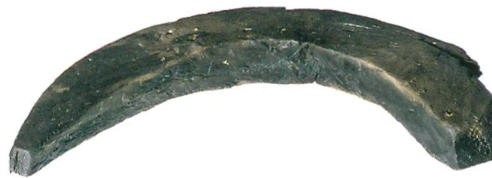
Abb. 3: Mörigen, Bucht. Dieses sichelförmige Holzartefakt mit quadratischem Querschnitt lag in der Nähe der freigespülten Konstruktionshölzer (Zone 1) auf dem Seegrund auf. M. 1:5.

Rund 100 m südlich davon konnten in einer kleinen Bucht zahlreiche Pfähle und aufstossende Schichtreste beobachtet werden (Abb. 1, Zone 3). Diese Hölzer wurden um 3140 v. Chr. geschlagen. Damit ist erstmals eine bereits seit Langem vermutete horgenzeitliche Siedlungsphase in Mörigen dendrochronologisch belegt.