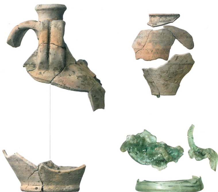
Abb. 1: Muri, Allmendingenweg 7. Beigaben aus dem Brandgrab: Fragmente eines Glanztonbechers, eines dreihenkligen Kruges und eines Glasgefässes. M. 1:3.