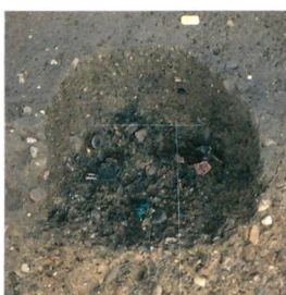
Abb. 2: Muri, Allmendingenweg 7. Das römische Brandgrab während der Freilegung. Blick nach Norden.

In der Ebene östlich von Gümligen im Bereich der heutigen Siloah-Klinik wurden 1902 spätbronzezeitliche Metallfunde, vermutlich Grabbeigaben, entdeckt. In den letzten zwanzig Jahren wurden mehrere grossflächige Bodeneingriffe im Areal archäologisch begleitet, aber keine Funde getätigt. Erst 2013 konnten bei Sondierungen im Vorfeld einer grösseren Überbauung südlich der Klinik neue Hinweise auf eine prähistorische Nutzung gewonnen werden. In einer flachen, rund vierzig Meter breiten und von Nordosten nach Südwesten verlaufenden Rinne in der Moräne hatte sich ein alter Humus mit vereinzelt kleinen Scherben aus Grobkeramik erhalten.