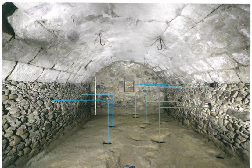
Abb. 4: Seedorf, Saumweg 3. Gewölbekeller unter dem Wohnteil um 1800. Eisenhaken, Balken- und Pfostenlöcher im Keller stammen von den ehemaligen Lagereinrichtungen. Blick nach Süden.

Abb. 3: Seedorf, Saumweg 3. Oberer Teil der alten Rauchküche. Erkennbar ist die starke Russverkrustung der Wände. Der Rauch konnte zwischen dem Wandrähm und den Deckenbrettern entweichen (weisser Pfeil). Anfang des 20. Jahrhunderts wurde der Schornstein eingebaut. Blick nach Osten.