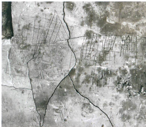
Abb. 5: Thun, Obere Hauptgasse 75. In den Verputz eingebrachter Sgraffito an der Ostwand des gassenseitigen Raumes in ersten Obergeschoss. Die Ritzungen entstanden zwischen dem frühen 18. Jahrhundert und der Zeit vor 1780. Sie zeigen zwei häusliche Alltagsszenen in einem längs und einem quer geschnittenen Haus inmitten von Blumen. M. 1:4.