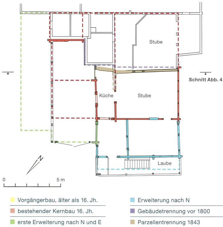
Abb. 5: Brienzwiler, Hutmättliweg 14. Grundriss des Erdgeschosses mit Kennzeichnung der in Resten erhaltenen Holzbauphasen. M. 1:200.