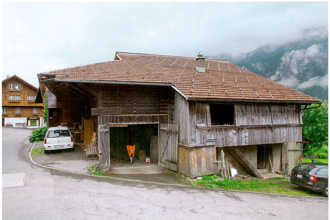
Abb. 2: Brienzwiler, Hutmättliweg 14. Freigelegtes Eckfundament der ehemaligen Giebelseite an der Dorfstrasse. Blick nach Südosten.

Abb. 1: Brienzwiler, Hutmättliweg 14. Links moderner Garageneinbau, rechts Laube, darunter Kellerzugang, darüber Eingang zum hoch gelegenen Erdgeschoss. Blick nach Südosten.