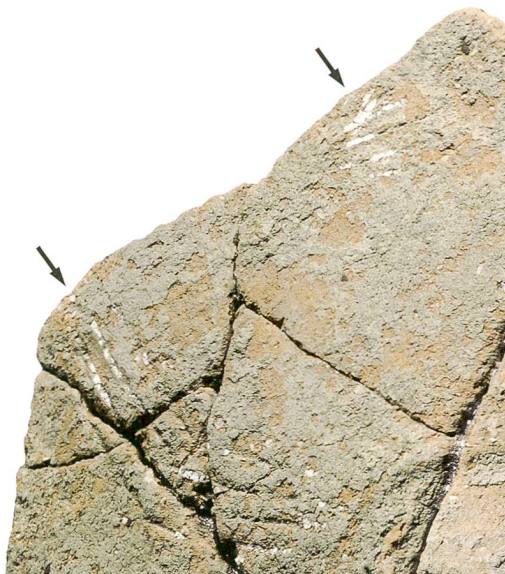
Abb. 10: Kehrsatz, Breitenacher. Detail einer Ritzverzierung mit weisser Inkrustation.

fältig ineinander aufgeschichtet (Abb. 7). Einige Scherben weisen Verformungen auf, wie sie entstehen, wenn gebrannte Keramik mit grosser Hitze in Kontakt kommt (Abb. 8). Darüber hinaus sind die Gruben auch aus folgenden Gründen aussergewöhnlich: Sie bilden einen quadratischen Grundriss (2,5 × 2 m), der in Grösse und Form den Speicherbauten entspricht, und liegen auf derselben Achse wie die restlichen Gebäude. Nur in einer Zone um die vier Gruben wurde eine archäologische Schicht gefasst, die sich hauptsächlich durch das Auftreten von vereinzelt verbrannten Knochenstückchen auszeichnet. Kalzinierte, das heisst verbrannte Knochen, wurden auch zwischen den absichtlich deponierten Scherben in den vier Gruben gefunden. Für derartige Deponierungen finden sich in der Schweiz bisher keine Parallelen.