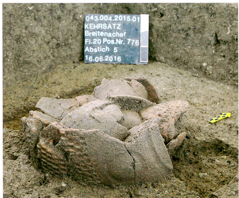
Abb. 7: Kehrsatz, Breitenacher. Die Keramikscherben in Grube 776 (Gr 7) wurden sorgfältig ineinandergestapelt. Blick nach Nordwesten.

nen zeugen vermutlich von ihrer Verwendung zum Kochen, ob es sich aber um Feuerstellen handelt, bleibt zurzeit offen. Acht solcher Strukturen konzentrieren sich auf einer Fläche von rund 100 m 2 . Unweit davon wurde eine mit 80 cm verhältnismässig tiefe Grube mit einem Durchmesser um 2,5 m dokumentiert. Sie wird als Silo interpretiert, also als Vorratsgrube, die der feuchtkühlen Lagerung von Lebensmitteln diente.