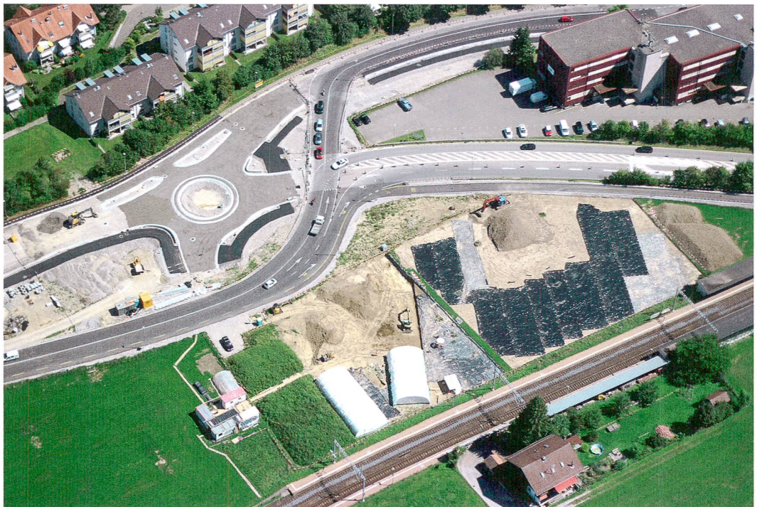
Abb. 1: Kehrsatz, Breitenacher. Luftaufnahme der archäologischen Grabung neben dem Bahnhof Kehrsatz Nord im August 2016. Die erste Baustetappe, der Kreisbau, läuft. Blick nach Osten.

Gruben, randvoll mit Keramikscherben, zahlreiche Pfostengruben, Feuerstellen und reichhaltiges archäologisches Fundmaterial: Seit Juni 2015 untersuchen Mitarbeitende des Archäologischen Dienstes des Kantons Bern auf dem Breitenacher in Kehrsatz am Fuss des östlichen Ausläufers des Gurtens die im Boden verborgenen Spuren einer bronzezeitlichen Siedlung. Ausgelöst wurden die Rettungsgrabungen durch ein Überbauprojekt der Burgergemeinde Bern, das neben einem Kreislauf auch einen Lebensmittelmarkt, eine Tankstelle und eine Wohnüberbauung umfasst (Abb. 1). Mit einer Grabungsfläche von insgesamt 15 000 m 2 bietet sich die für den Kanton Bern seltene Chance, die räumliche Organisation einer prähistorischen Landsiedlung zu untersuchen.