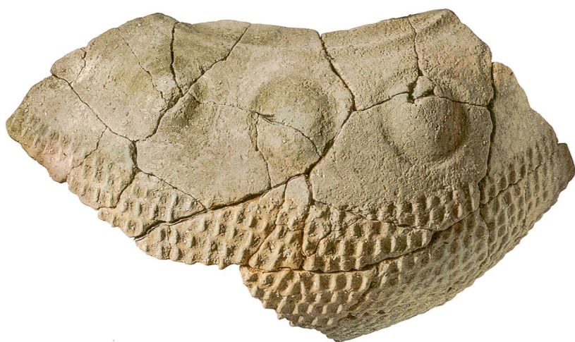
Abb. 9: Kehrsatz, Breitenacher. Keramikgefäss mit charakteristischer Buckelverzierung. M. 1:3.

Schwieriger zu deuten sind vier geheimnisvolle Gruben weiter östlich. Die kleinen Gruben (Gr7) mit einem Durchmesser zwischen 30 und 40 cm waren vollständig mit Keramikscherben gefüllt. Die bis zu 25 cm gross erhaltenen Scherben wurden nicht einfach als Abfall wild gemischt entsorgt, vielmehr waren sie sorg-