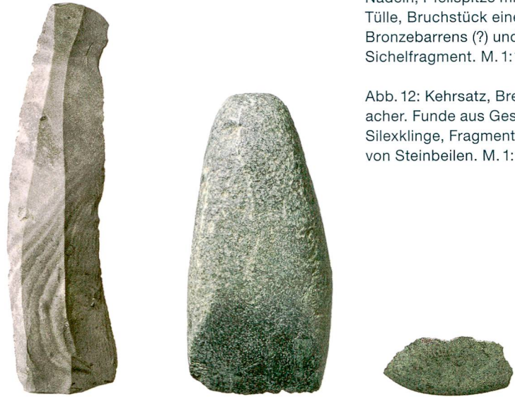
Abb. 12: Kehrsatz, Breitenacher. Funde aus Gestein: Silex Klinge, Fragmente von Steinbeilen. M. 1:1.

zeit (1500–1300 v. Chr.) zu. Eine Nutzung der Geländeterrasse im Neolithikum ist anhand der Steinbeilfragmente und Radiokarbonaten belegt, das Mesolithikum durch eine datierte Feuerstelle. Eine Münze des römischen Kaisers Claudius Gothicus (268–270 n. Chr.) und ein kleiner römischer Keramikkomplex erinnern an den nur wenige hundert Meter nördlich gelegenen Gutshof von Köniz, Chlywabere. Vereinzelt radiokarbondatierte Holzkohlestücke deuten auf eine mittelalterliche Nutzung des Areals und unterstreichen, dass die Ebene am Gurtenfuss seit Jahrtausenden praktisch durchgehend genutzt oder bewohnt wurde.