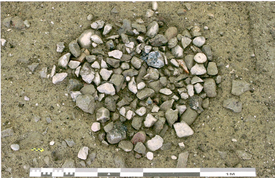
Abb. 6: Kehrsatz, Breitenacher. Struktur 876, vermutlich eine Feuerstelle, besteht aus hitzegepresstrenkten und -geröteten Steinen. Einige Bruchstücke passen zusammen, sie sind vermutlich in situ zerbrochen.

war auf einem Grossteil der Grabungsfläche erhalten und konnte untersucht werden. In dieser Schicht fanden sich in erster Linie regelmässig auftretende hitzegepresstrenkte Steine sowie mehr oder weniger zahlreiche Keramikscherben. In oder unter der Schicht erscheinen die bronzezeitlichen Strukturen. Neben der zeitlich begrenzten Dauer der Siedlungstätigkeit haben auch Auflassungsphänomene, insbesondere die jahrtausendelange landwirtschaftliche Nutzung des Areals, zur Zerstörung vieler archäologischer Befunde wie Gehniveaus geführt.