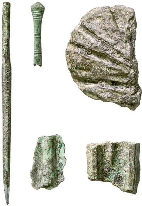
Abb. 11: Kehrsatz, Breitenacher. Funde aus Bronze: Nadeln, Pfeilspitze mit Tülle, Bruchstück eines Bronzebarrens (?) und Sichelfragment. M. 1:1.