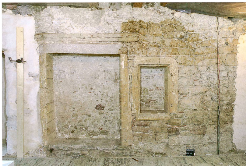
Fig. 3 : La Neuveville, Grand Rue 15. Bâtiment A, rez-de-chaussée. Grandes niches murales à encadrements en pierre de taille. Vue vers l'ouest.

Le bâtiment A, à l'ouest, a été fortement transformé au rez-de-chaussée ; la lecture de son organisation ancienne reste difficile. Le solide plafond en madriers de la pièce antérieure, contre le mur d'enceinte, recoupe le mur mitoyen ouest et remonte au début du 16 e siècle (après 1507, selon l'analyse dendrochronologique). Il supporte un sol de briques en terre cuite scellées dans un lit de mortier. Différentes niches de conception soignée, datant probablement des 17 e -18 e siècles, équipent le rez-de-chaussée (fig. 3) qui avait probablement une fonction économique (atelier, artisanat). L'accès à l'étage n'a pas pu être localisé, mais les restes fragmentaires d'une niche à lumière dans le mur ouest suggèrent sa