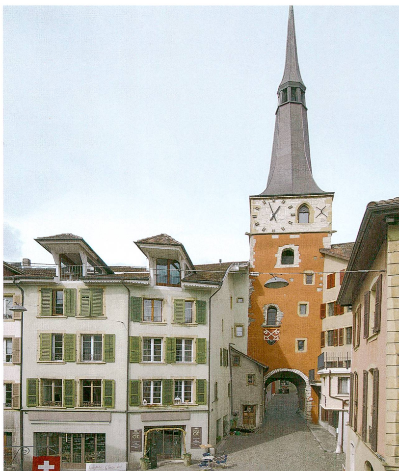
Fig. 1 : La Neuveville, Grand Rue 15. Le bâtiment étudié se situe dans le vieux bourg, à côté de la Tour Rouge, une des deux tours-portes de la ville médiévale.