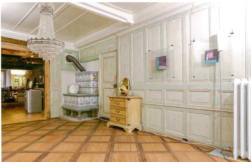
Fig. 4 : La Neuveville, Grand Rue 15. Bâtiment A, 1 er étage. Pièce méridionale après restauration : le parquet est d'origine et le poêle du 18 e siècle, provenant du dépôt du Service des monuments historiques bernois, occupe l'angle de la pièce prévu à cet effet. Vue vers le nord-est.

présence à cet endroit. À l'étage, la cuisine centrale aveugle, équipée d'une grande hotte, était flanquée d'une vaste pièce lumineuse au sud (fig. 4) et d'une ou deux chambres au nord. Un chevêtre conservé dans le solivage supérieur ainsi qu'une niche à lumière signalent l'emplacement d'un escalier reliant la cuisine au second étage. Au-dessus de la cuisine, la poutraison a révélé les traces d'un début d'incendie, à l'origine peut-être de l'effondrement partiel de l'étage supérieur ; les datations dendrochronologiques de ces bois renvoient à la première moitié du 18 e siècle (après 1719). Par contre, le plafond de la pièce nord dallée de terres cuites