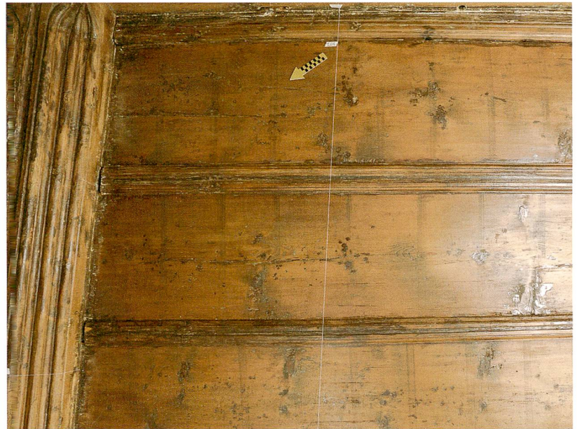
Fig. 8 : La Neuveville, Grand Rue 15. Bâtiment B, 1 er étage. Détail du plafond à couvre-joints orné d'un décor de bandes formées de lignes incisées datant du début du 16 e siècle.

Le bâtiment de la Grand Rue 15 a livré une partie de ses richesses couvrant cinq siècles d'histoire ; la qualité architecturale de son bâti et de ses éléments de décor révèlent un statut social aisé. Si l'on doit regretter la disparition des enduits anciens, sans doute peints à l'origine vu la qualité des plafonds, les générations futures