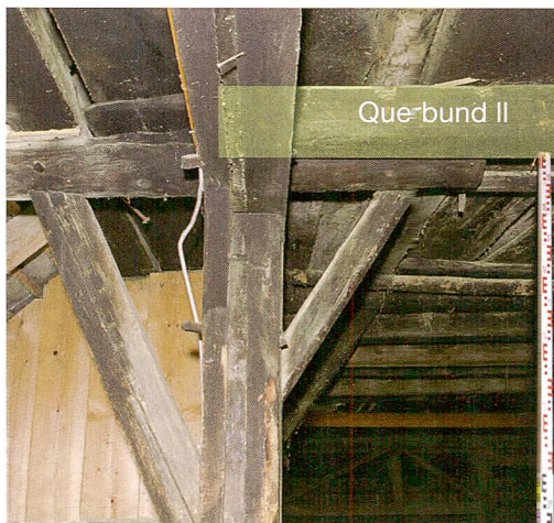
Abb. 4: Lützelflüh, Moosmatt 727a. Der Eckständler des kleinen, nord-westlichen Gadens wird zwar vom Rähmbalken überkämmt, doch ist der Querbund II zu kurz und liegt nicht in der Wandflucht, um die Flugpfette zu stützen. Dem Rähm wurde daher ein kurzes Holz mit Kopfstreben aufgekämmt, das diese Funktion übernimmt: eine äusserst ungewöhnliche Konstruktion. Blick nach Nordosten.

wie üblich kraftschlüssig auf Tragwände übertragen und bis auf die Erde abgeleitet wird. Vielfach sind die tragenden Wände um einige Zentimeter verschoben. In einigen Fällen wurden extra Hölzer eingebaut, um die konstruktiven Mängel zu beheben (Abb. 4). Sogar das Dachwerk war einst anders zusammengesetzt, wie leere Zapflöcher im First und Blattsassen im Unterfirst belegen.