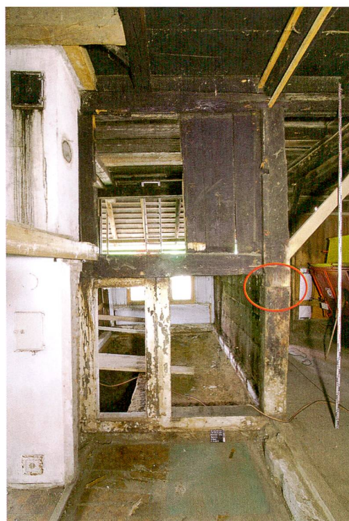
Abb. 3: Lützelflüh, Moosmatt 727a. Die zweigeschossigen Eckständer wurden aus jeweils zwei Hölzern errichtet. Diese aufeinandergestellten Ständer sind nicht kraftschlüssig und zeigen daher einen deutlichen Verzug. Blick nach Nordosten.

Abb. 2: Lützelflüh, Moosmatt 727a. Querschnitt. Im Schnitt ist deutlich zu sehen, dass Gaden- und Dachgeschoss schmaler sind als das Erd- und Kellergeschoss. Blick nach Südwesten. M. 1:200.