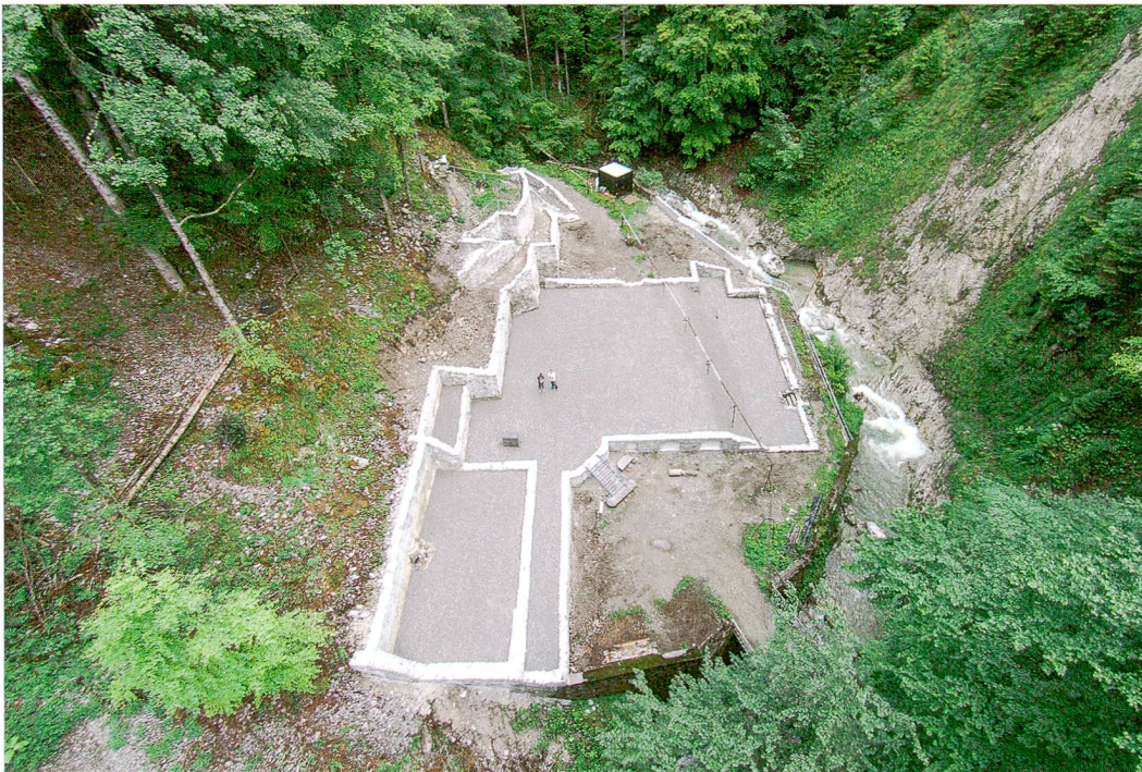
Abb. 1: Oberwil i. S., Bad Weissenburg. Hinteres Bad nach der Sanierung im August 2015. Drohnensfoto.

Die Ruinen des Hinteren Weissenburgbades wurden in zwei Sanierungsetappen im Gelände wieder sichtbar gemacht und konserviert (Abb. 1, 5a und b). Der Verein Bad und Thermalquelle Weissenburg und der Archäologische Dienst des Kantons Bern haben das Projekt in den Jahren 2014 und 2015 gemeinsam mit Bauunternehmen aus der Region realisiert. Heute quert der Wanderer auf seinem Weg durch das Bunschetal (ehemals Bunschental) das historische Badegebäude. Als Ersatz für den ursprünglichen Eingang aus Granit führt nun eine Metalltreppe vom ehemaligen Spazierhof hinauf zum Erdgeschoss des einstigen Kurhotels.