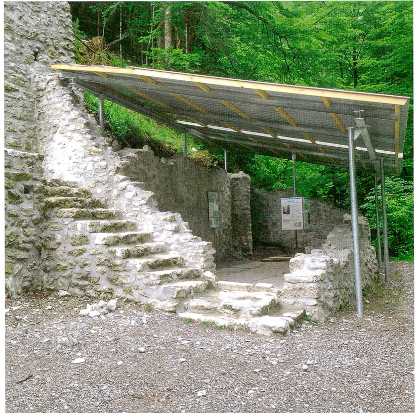
Abb. 4: Oberwil i. S., Bad Weissenburg. Das ehemalige Metzgereibau mit Schutzdach und Informationstafeln im Sommer 2016.

Zukünftig gilt es auch, von archäologischer Seite vermehrt das Augenmerk auf Ruinen, erhaltene Gebäude und Bodendenkmäler der historischen Badekultur im Kanton Bern zu legen. Ansonsten droht der vollständige Verlust historischer Zeugnisse eines für den Staat Bern zwischen dem 16. und frühen 20. Jahrhundert eminent wichtigen Gewerbe- und Wirtschaftszweiges.