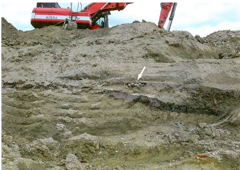
Abb. 7: Thun, Im Scho- ren 20. Der graue Sied- lungshorizont aus der be- nachbarten Parzelle «Im Schoren 10» setzte sich bis in dieses Baufeld fort, aber Funde und Struktu- ren konzentrierten sich auf eine kleine Fläche. Die erste Grube zeichnete sich als Konzentration hitzegesprengter Steine und Holzkohle ab (Pfeil). Blick nach Nordosten.

wie in Einigen liegen. Vom Seebecken am Aus- fluss des Sees fehlten aber Hinweise auf Sied- lungen. Dies änderte sich mit dem Nachweis einer bronze- und hallstattzeitlichen Nutzung des Thuner Schlossberges und der Entdeckung der Fundstelle vor der Schadau 2014. Mit den neuen, hier vorgestellten Siedlungen verdich- tet sich das Bild der Nutzung des Seebeckens weiter. Bestattungen, deren Grabbeigaben in die gleiche Zeit gehören wie das ältere Dorf im Schoren und vielleicht die ältere Phase in der Schadau, wurden 1946 im 1,8 km entfern-