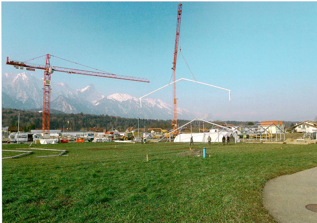
Abb. 1: Thun, Im Schoren 10. Nachdem die erste Teilfläche ausgegraben wurde, wird das Zelt umgestellt, damit auch bei winterlicher Witterung gearbeitet werden kann. Blick nach Osten.

REGULA GUBLER, MARCO AMSTUTZ UND LEONARDO STÄHELI