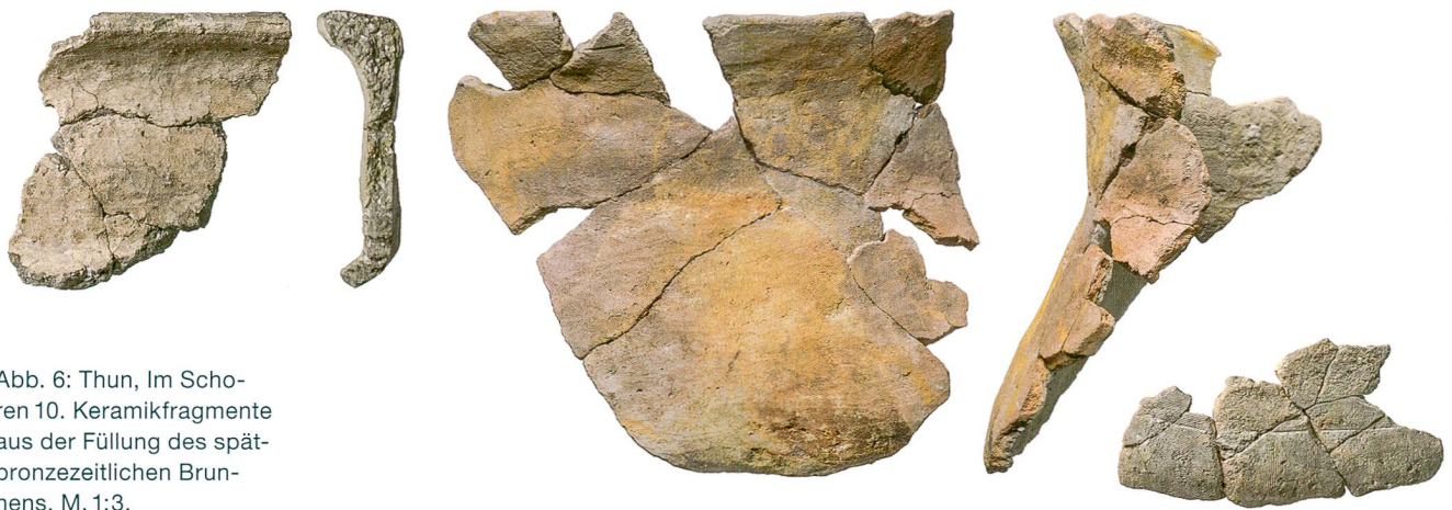
Abb. 6: Thun, Im Scho- ren 10. Keramikfragmente aus der Füllung des spät- bronzezeitlichen Brun- nens. M. 1:3.

Abb. 7: Thun, Im Scho- ren 20. Der graue Sied- lungshorizont aus der be- nachbarten Parzelle «Im Schoren 10» setzte sich bis in dieses Baufeld fort, aber Funde und Struktu- ren konzentrierten sich auf eine kleine Fläche. Die erste Grube zeichnete sich als Konzentration hitzegesprengter Steine und Holzkohle ab (Pfeil). Blick nach Nordosten.