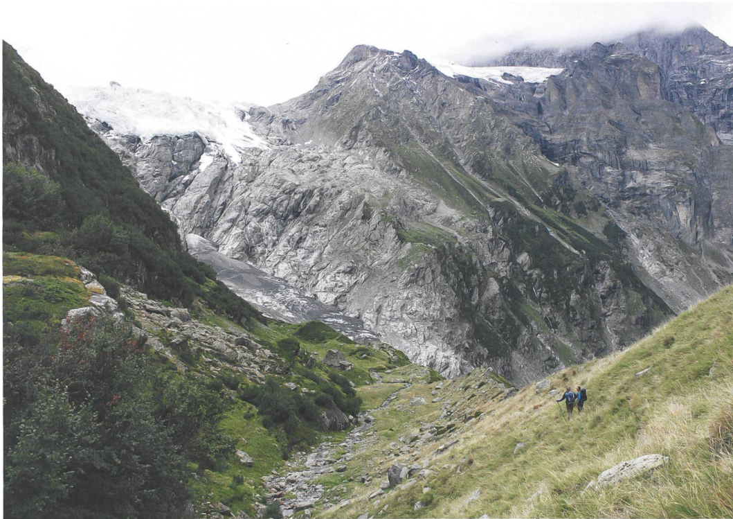
Abb. 8: Grindelwald, Zäsenberg. Die Geländeterrassen des Zäsenbergs sind noch heute eine grüne Insel, nicht mehr im Eis, aber in der Geröllwüste des verschwundenen Gletschers. Im Hintergrund die Grashänge des Challi, die ebenfalls als Weidegebiet der Gletscheralp dienten. Blick nach Westen.

die Zeit, um mit Sondierungen nach Nutzungsniveaus und archäologischen Datierungshinweisen für die Bauten zu suchen. Aber dieser erste archäologische Augenschein belegt eine unerwartete Menge an Spuren der Alpwirtschaft und des frühen Alpinismus im Gelände der heute so unzugänglichen Alpweiden auf dem Zäsenberg. Mit weiteren Entdeckungen und Erkenntnissen zur Geschichte dieser isolierten Gletscheralp ist mit Sicherheit zu rechnen (Abb. 8).