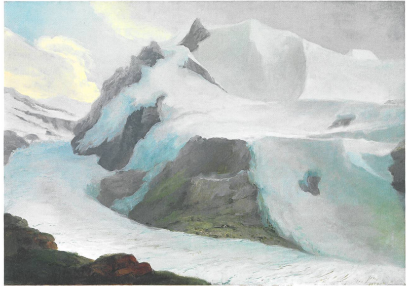
Abb. 3: Grindelwald, Zäsenberg. Caspar Wolf malte 1774 den Blick von der Bänisegg über den Unterer Grindelwaldgletscher und das Fiescherhornmassiv. Auf den grünen Matten des Zäsenbergs steht eine Alphütte. Kunst Museum Winterthur, Stiftung Oskar Reinhart.

Auf diesen Fotografien und einer Skizze von John Sargent von 1870 sind zwei Hütten mit Pultdächern zu sehen, die sich an den auffallenden Felsblock lehnen. Sie sind auch im Gelände noch heute sehr gut erkennbar mit bis zu 2,2 m hohen und 1,5 m starken Trockenmauern (Abb. 4,8 und Abb. 6). Das Gebäude bestand aus zwei Räumen (Innenmasse 3 \times 3 m und