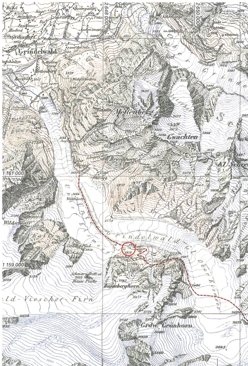
Abb. 2: Grindelwald, Zäsenberg. Auf der Siegfriedkarte von 1870 verläuft der Weg von Grindelwald und der Bäegg über den Unteren Grindelwaldgletscher auf den Zäsenberg, wo zwei Gebäude eingezeichnet sind. Die Fortsetzung des Weges führte über die Grashänge über dem Zäsenberg auf das Obere Eismeer Richtung Strahlegg oder Finsteraarjoch. M. 1:50000.