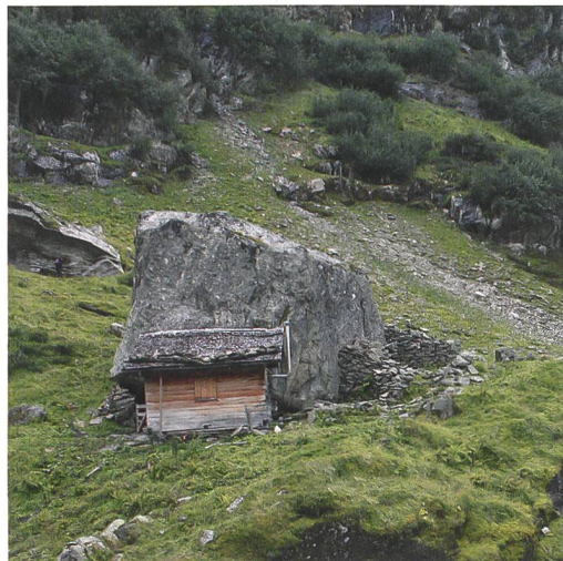
Abb. 7 (rechts): Grindelwald, Zäsenberg. Situation wie auf Abb. 6 mit der Hütte und der ummauerten Balm im August 1889 (Jules Beck, Ausschnitt «Heisse Platte und Eiger von den Zäsenberghütten»). Blick nach Südwesten. Alpines Museum.

Abb. 6 (links): Grindelwald, Zäsenberg. Rechts der heutigen Holzhütte liegen die Mauern der 1824 genutzten Hütte, links die Abschlussmauer des Felsunterstandes. Blick nach Süden.