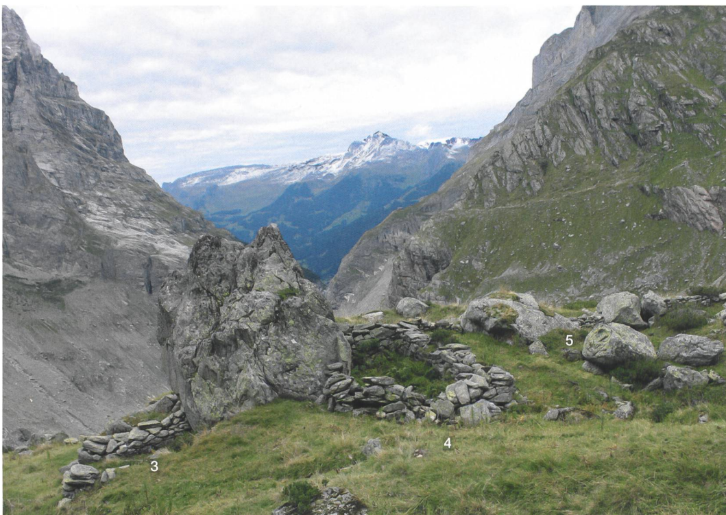
Abb. 1: Grindelwald, Zäsenberg. Blick vom Zäsenberg talauswärts nach Grindelwald. Im Vordergrund der markante Felsblock am Westende der Terrasse mit den Gebäudegrundrissen 3 und 4 (s. Abb. 4). Die Weidemaier 5 schützt das Vieh vor der dahinterliegenden Felswand. Blick nach Nordwesten.

Der Zäsenberg war eines der Läger der Bergschaft Gletscheralp. Diese war seit 1146 im Besitz des Augustinerklosters Interlaken und wurde 1406 noch als selbständige Alpgenossenschaft Gletscheralp aufgeführt. Später wurde sie von den Grindelwalder Bergschaften Grindel und Scheidegg übernommen. Grindel durfte 19 Ochsen auf die Gletscheralp treiben, Scheidegg 16 Ochsen oder «für ein Ochsen vier Schaf