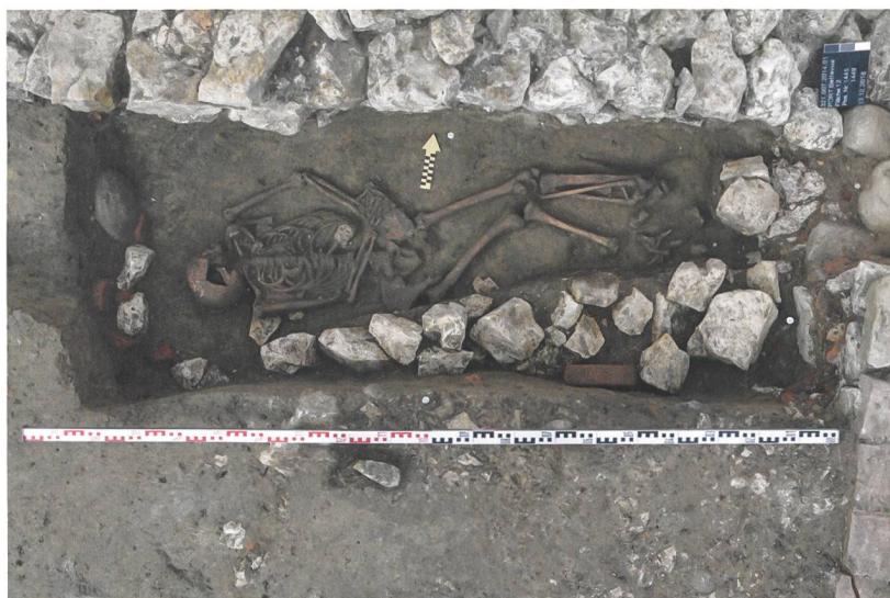
Abb. 6: Port, Bellevue. Frühmittelalterliche Körperbestattung einer etwa 40-jährigen Frau. Blick nach Norden.

Für das Gebiet des heutigen Kantons Bern ausserordentlich ist die beinahe monumentale Anlage mit dem luxuriösen Badetrakt. Auch hier stellt sich wieder die Frage nach Funktion und Bedeutung. Da bislang Hinweise auf eine eigentliche pars rustica , also einen Ökonomiebereich fehlen, scheint es sich in Port, Bellevue weniger um eine villa rustica im üblichen Sinne eines Landgutes und landwirtschaftlichen Grossbetriebs gehandelt zu haben. Diskutiert werden muss, ob die Anlage in Zusammenhang mit den nahen Verkehrswegen zu Land und zu Wasser entstand und beispielsweise als Herberge/ mansio diente. Auch die erstaunlich frühe Aufblas-