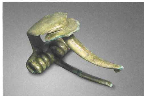
Abb. 1: Port, Bellevue. Kragenfibel, Bronze, erste Hälfte des 1. Jahrhunderts v. Chr. M. 1:1.

Kiesbelag des Weges lieferten C 14 -Daten und belegen seine Nutzung im 1. Jahrhundert v. Chr. (Abb. 7, BE-3558, BE-7853.1). Dies weist auf Aktivitäten auf der Terrasse von Bellevue in den letzten Jahrzehnten vor oder in der unmittelbaren Frühzeit der römischen Einflussnahme auf das Schweizerische Mittelland hin. Ebenfalls in diesen Zeithorizont gehört eine Kragenfibel, welche leider als Streufund keinem Befund zugewiesen werden konnte (Abb. 1).