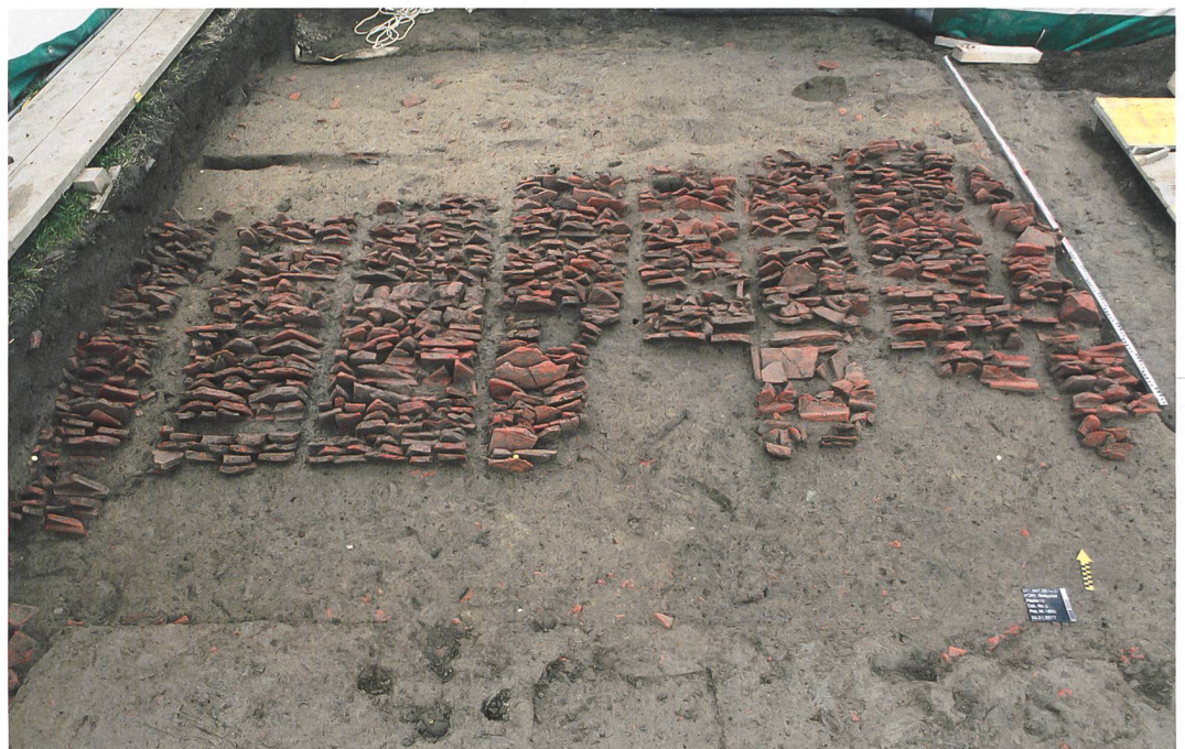
Abb. 5: Port Bellevue. Verstärzte Fachwerkwand mit Ausfachungen aus wiederverwendeten römischen Dachziegeln. Die Stellen, wo sich einst die nun zersetzten Ständer befanden, sind deutlich sichtbar. Blick nach Norden.

Von herausragendem Interesse und überregionaler Bedeutung sind dabei die frühen Holzbaubefunde, welche bereits in augusteischer Zeit bedeutende Aktivitäten auf dem Platz