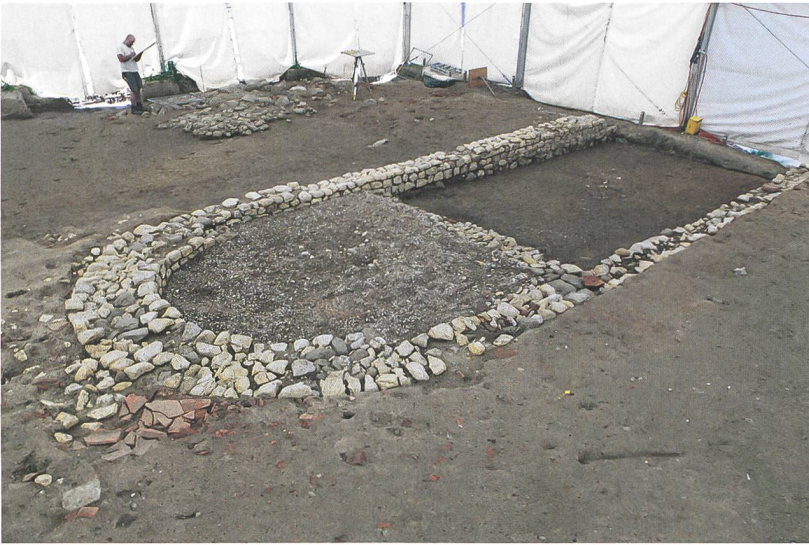
Abb. 4: Port, Bellevue. Südlicher Abschluss der Portikus mit Apsis. Die Reste des Mörtelbodens im Apsisraum sind gut zu erkennen. Blick nach Nordwesten.

in Ständerbauweise ausgeführte Einzelbauten, von denen noch die untersten Fundamentlagen der Sockelmauern erhalten waren. Das bereits bestehende östlichste Gebäude im Hofbereich wurde abgebrochen und etwas kleiner am selben Standort wieder erbaut. Vermutlich zeitgleich mit diesem Umbau wurde auch die bereits bestehende Feuerstelle erneuert. Eine massive Sickerpackung in der Nordostecke dieses Baus deutet darauf hin, dass statische Probleme aufgrund des Hangwasserdrucks den Neubau notwendig gemacht haben könnten.