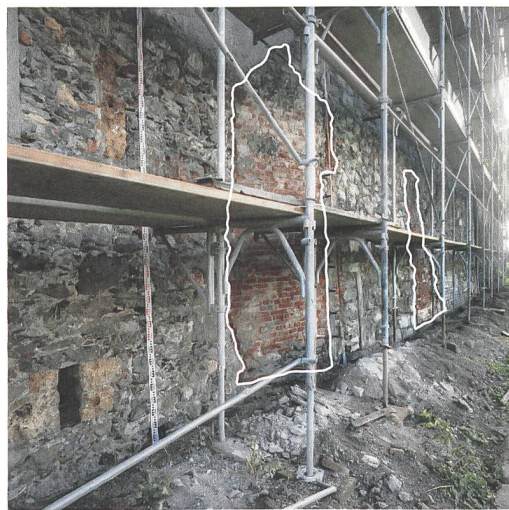
Abb. 3 (rechts): Spiez, Neues Schloss. Rot eingefärbt ist die gut 1,9 cm mächtige Ringmauer. Sie ist mit der abgehenden Umfassungsmauer klar im Verband. Blick nach Süden.

Abb. 1 (links): Spiez, Neues Schloss. Ansicht der 1988 freigelegten Südfassade des Neuen Schlosses. Grau eingefärbt sind die Mauerausbrüche, welche mit Vollbacksteinen verschlossen wurden. Blick nach Südosten.