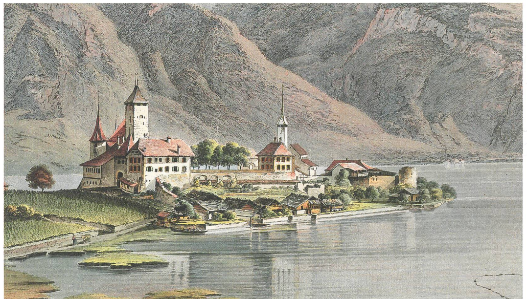
Abb. 2: Spiez, Neues Schloss. Kolorierte Umrissskizze von Heinrich Rieter, um 1784. Das neue Schloss wurde 1746 erbaut. Die mittelalterliche Mauer zwischen Schloss und Bucht bestand damals noch. Blick nach Osten.

Bern (ADB) begleitet daher seit vielen Jahren sämtliche Boden- und Gebäudeeingriffe in diesem Bereich, so 2016 Arbeiten am sogenannten Neuen Schloss. Bereits 1988 konnte die Südfassade dieses Gebäudes untersucht werden. Dabei stellte sich heraus, dass diese auf der mittelalterlichen Ringmauer steht. Ausserdem konnten darin zwei Mauerausbrüche, welche mit Vollbacksteinen verschlossen waren, dokumentiert werden. Sie wurden damals als Reste eines abgebrochenen Halbschalenturms interpretiert (Abb. 1).