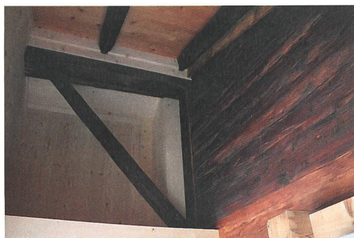
Abb. 7: Zweisimmen, Lusflue-Weg 6. Frühester bekannter Vertreter ohne Heidenkreuz im westlichen Berner Oberland. Aussenansicht des Giebels der Westfassade, heute von jüngerer Laube verdeckt. Schlagjahre 1506/1508.

Der ADB führte in Oberried am Brienzensee im Vorfeld eines Umbaus eine Bauuntersuchung an einem mit Schindeln eingefassten Blockbau durch. 20 Laut Bauinventar datiert er nach seiner äusseren Erscheinung um das Jahr 1880, im Kern wurde jedoch zu Recht eine Bauzeit «möglicherweise 16. Jh.» vermutet. Die durchgeführte dendrochronologische Untersuchung brachte die Überraschung: Vom Erd- bis zum Dachgeschoss konnte ein weitgehend intakter Gründungsbau mit Schlagjahren zwischen 1475 und 1478 erfasst werden (Abb. 8). 21 Kurz zuvor stellte sich auch der typologisch ins «16. Jh.» datierte Gründungsbau an der Oberdorfstrasse 92/94 in Brienz als Bau des Jahres 1498 heraus. 22 Beide haben kein Heidenkreuz. Lässt sich daraus schliessen, dass wir auch im westlichen Berner Oberland frühe Bauten ohne Heidenkreuz finden müssten?