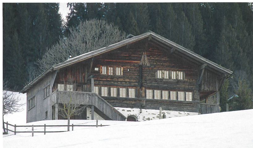
Abb. 3: Saanen, Schibeweg 15. Das bislang jüngste dendrodatierte Haus mit einem Heidenkreuz, erbaut kurz nach 1509.

Jahren 1455 und 1456 (Abb. 2). Die Untersuchung liegt fast 40 Jahre zurück, an den Resultaten hat sich nichts geändert. 8 In derselben Publikation wird das Gebäude in Oey-Diemtigen, Bächlen 12 ins Jahr 1507 («mögliche Waldkante») datiert. 9 Eine kleine Zahl an Untersuchungen vergleichbarer Bauten wurde auch durch das Labor Egger durchgeführt. Alle Datierungen wurden überprüft und konnten bestätigt werden, so beispielsweise für das Wohnhaus an der Mattenstrasse 90 in Saanen, das «nach 1470» datiert. 10 Die Datierung erschliesst sich aus sechs Dendrodaten, allesamt jedoch ohne Waldkanten. Die letzten erhaltenen Ringe streuen zwischen 1430 und 1470. Die Anzahl fehlender Jahrringe kann nicht genau eruiert werden. So ergibt sich in diesem Falle lediglich ein terminus post quem , also ein Datum «jünger als». Der Fällzeitpunkt dürfte aufgrund der Streuung der Daten in den Jahren um 1500 liegen. Auch für das Heidenhaus in Erlenbach-Ringoldingen mit datierten