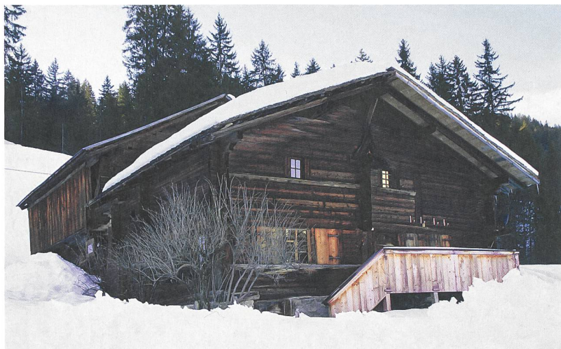
Abb. 2: Lauenen, Hintersee- strasse 88. Ältestes Holzhaus des Berner Oberlandes. Das Haus wurde kurz nach 1456 erbaut und hat dank seiner Abgeschiedenheit die Jahrhunderte überdauert.

Jahren 1455 und 1456 (Abb. 2). Die Untersuchung liegt fast 40 Jahre zurück, an den Resultaten hat sich nichts geändert. 8 In derselben Publikation wird das Gebäude in Oey-Diemtigen, Bächlen 12 ins Jahr 1507 («mögliche Waldkante») datiert. 9 Eine kleine Zahl an Untersuchungen vergleichbarer Bauten wurde auch durch das Labor Egger durchgeführt. Alle Datierungen wurden überprüft und konnten bestätigt werden, so beispielsweise für das Wohnhaus an der Mattenstrasse 90 in Saanen, das «nach 1470» datiert. 10 Die Datierung erschliesst sich aus sechs Dendrodaten, allesamt jedoch ohne Waldkanten. Die letzten erhaltenen Ringe streuen zwischen 1430 und 1470. Die Anzahl fehlender Jahrringe kann nicht genau eruiert werden. So ergibt sich in diesem Falle lediglich ein terminus post quem , also ein Datum «jünger als». Der Fällzeitpunkt dürfte aufgrund der Streuung der Daten in den Jahren um 1500 liegen. Auch für das Heidenhaus in Erlenbach-Ringoldingen mit datierten