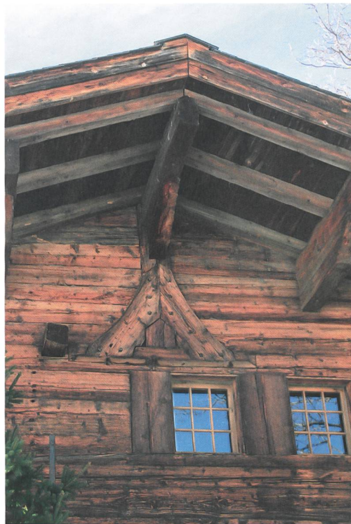
Abb. 5: Saanen, Mattenstrasse 90. Heidenkreuz an einem Wohnhaus aus der Zeit nach 1470. Die beiden Fussstreben sind mit dem Firstständer sowie dem Rähm verblattet und mit Holznägeln fixiert.