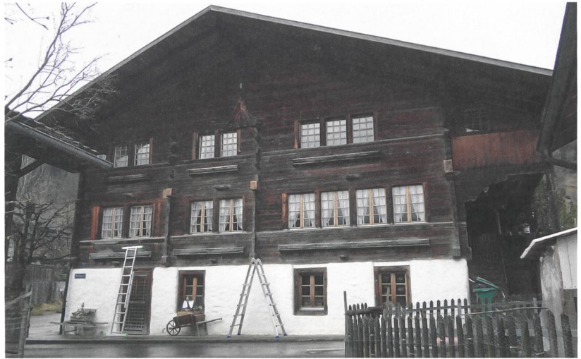
Abb. 4: Frutigen, Wallisgasse 1. Die ältesten Teile des Wohnhauses stammen aus der Zeit kurz nach 1474, die Stubenfront ist jünger.

Beim Betrachten der Verbreitungskarte fällt auf, dass alle ländlichen Wohnbauten des Berner Oberlandes, welche rein typologisch in die Zeit um 1500 datiert werden, ein solches Heidenkreuz besitzen. Es handelt sich um ein Leitmotiv dieser Zeit. Bis wann diese Heidenkreuze verwendet wurden und wie schnell dieses markante Bauelement verschwand, ist noch unklar. Das älteste bislang bekannte stammt aus dem Jahre 1456 (Abb. 2), das jüngste von 1509 (Abb. 3). Ebenso unklar ist, ob gar alle älteren Bauten im westlichen Berner Oberland ein solches Heidenkreuz aufweisen. Ein frühes Beispiel ohne Heidenkreuz finden wir in Oey-Diemtigen, Hasli 9. Hier steht das älteste inschriftlich datierte Gebäude mit der mutmasslich zum Gründungsbau gehörenden Jahreszahl 1516. 18 Kein Heidenkreuz, jedoch einen Firstständer mit Kopfstrebe finden wir beim kurz nach Herbst/Winter 1508/09 errichteten Wohnhaus am Lusflue-Weg 6 in Zweisimmen-Blankenburg (Abb. 7). 19 Die Konstruktion des Firstständers entspricht derjenigen des Heidenkreuzes, jedoch ohne Fussstreben. Das Haus stellt damit den frühesten bekannten Vertreter des westlichen Berner Oberlandes ohne Heidenkreuz dar.