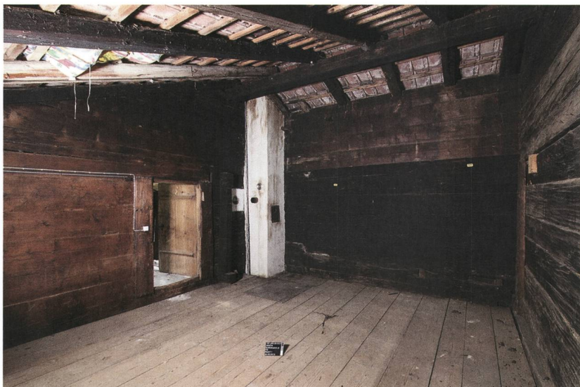
Abb. 4: Aeschi, Suldhaltenstrasse 8. Die beiden Bauholzbestände im oberen Bereich der Rauchküche: Die kantig zugehauenen Blockhölzer zeigen eine kräftige Russchwärzung (rechts der Tür) und die unregelmässiger und gröber zugehauenen Blockhölzer teils eine rötliche Färbung (links der Tür). Blick nach Westen.

Russchwärzung und andererseits teils grob zugehauene Hölzer, die an den Kanten oftmals noch über ihre Waldkante, also die natürliche Stammrundung, verfügten und die eine geringere Russfärbung aufwiesen. Diese zwei Holzbestände liegen sauber getrennt, aber dennoch übereinander geschichtet vor. So besteht beispielsweise die Gadenrückwand nordwestseitig der Türe aus den schwarzen Kanthölzern, nordostseitig der Türe hingegen aus rötlichen Hölzern (vgl. Abb. 4). Im Bereich der Giebelfassaden sind diese zwei Blockholzbestände jeweils in Wandständer eingebunden und auf diese Weise etwas unbeholfen miteinander verbunden. Als weiteres Indiz für die Verbauung alter Bauholzbestände ist die starke, einseitige Russchwärzung der Gadenbinnenwand zu werten, die an dieser Lage ungewöhnlich ist, es sei denn,