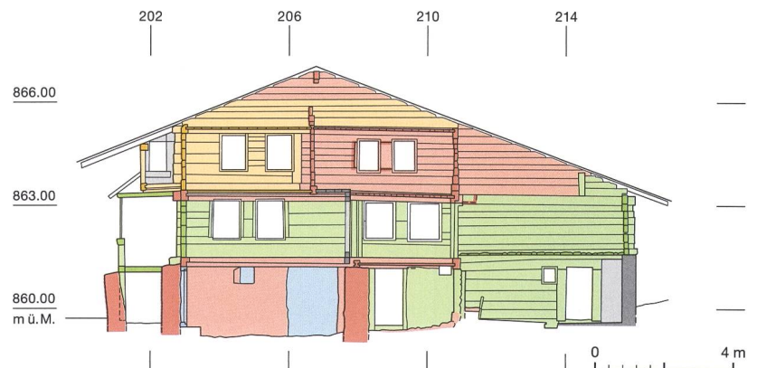
Abb. 3: Aeschi, Suldhaltenstrasse 8. Querschnitt durch das Gebäude. Rot: Grundkonstruktion; orange: jüngerer Umbau oder zweiter Bauholzbestand; blau: diverse Zumauerungen; grün: Umbau (19. Jh.); grau: jüngste Umbauten mit Zement. Blick nach Südwesten. M. 1:200.