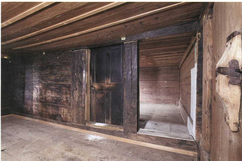
Abb. 5: Aeschi, Suldhaltenstrasse 8. Die Binnenwand zwischen den Gaden zeigt auf einer Seite eine deutliche Russchwärzung, die innerhalb eines Gadens sehr ungewöhnlich ist.

diese Gadenbinnenwand diente in einem anderen Gebäude als Rückwand der Rauchküche (Abb. 5). Die Befunde sind aber nicht so eindeutig, dass sie die Gegenthese eines grossen Umbaus ausschliessen.