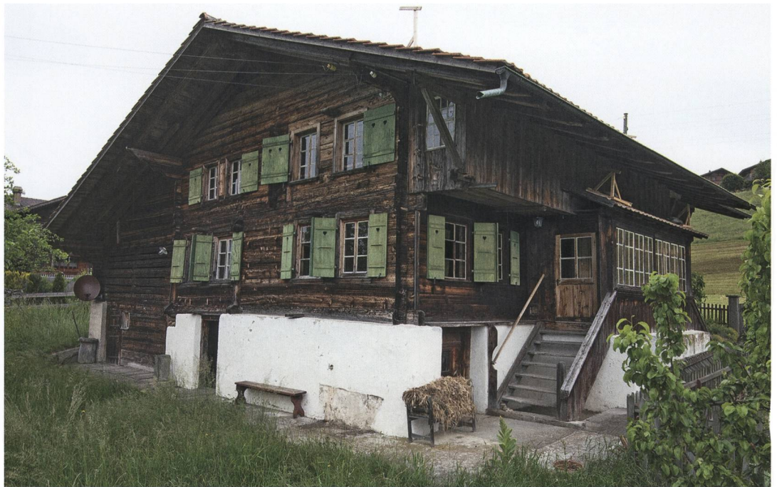
Abb. 1: Aeschi, Suldhaltenstrasse 8. Die südwestliche Giebelseite bildete die Schaufassade, die kaum Bauschmuck zeigte. Im Nordwesten setzt sich der Ökonomieteil deutlich durch die Holzfront ab. Blick nach Norden.

Südlich des Dorfes Aeschi, etwas oberhalb der Landstrasse nach Mülönen stand ein einfaches Bauernhaus (Abb. 1), das mit seiner Giebelfassade nach Südwesten zeigte. Es verfügte über einen Steinsockel und einen darüberliegenden hölzernen Hausteil, auf dem ein Giebeldach ruhte. Mit seiner firstparallel eingerichteten Ökonomie, die das nordwestliche Drittel des Gebäudes einnahm, gehörte das Bauernhaus zum sogenannten «Frutigtyp» und wies damit eine regionaltypische Hausform auf. Bevor das Gebäude im Sommer 2018 abgebrochen und durch einen Neubau ersetzt wurde, konnte es bauarchäologisch untersucht und dokumentiert werden.