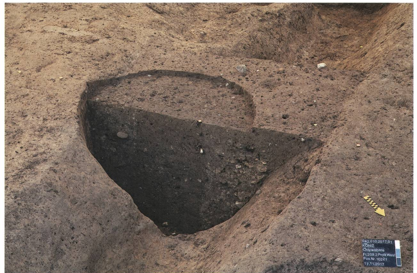
Abb. 4: Köniz, Chlywabere BLS. Eine Pfostenreihe schneidet einen älteren Drainagegraben.