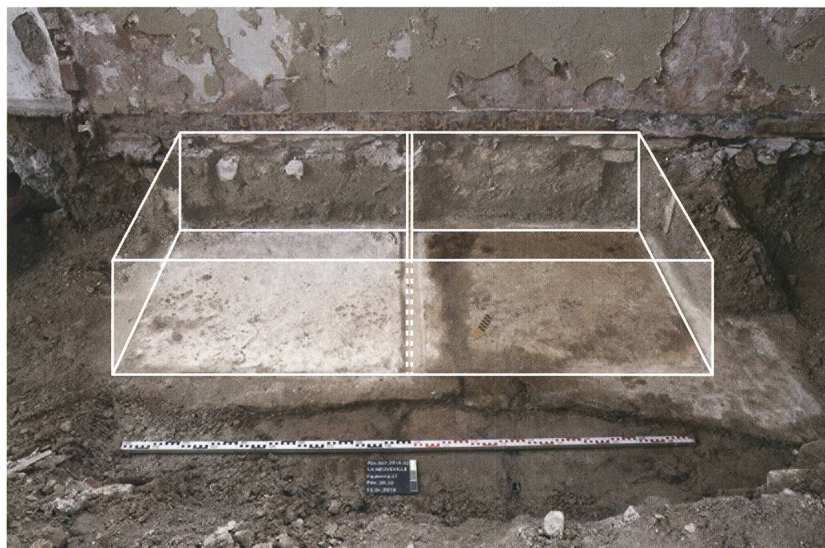
Fig. 3: La Neuveville, Rue du Faubourg 27. Vue de la dalle calcaire monolithique apparue sous les remblais du 20 e siècle. Les rainures taillées accueillait des éléments calcaires verticaux qui délimitaient deux bassins (restitution en blanc). Vue vers le sud.

L'intervention du SAB devait se limiter à la documentation de l'ancien mur de façade devenu mur mitoyen ; mais l'apparition de structures rectangulaires arasées en pierre de taille sous les remblais modernes du rez-de-chaussée attisa notre curiosité. À l'intérieur, au pied du mur méridional percé de quatre baies, trois structures sont apparues : une dalle monolithique de calcaire, un négatif rectangulaire lié à l'arrachement d'une seconde dalle calcaire