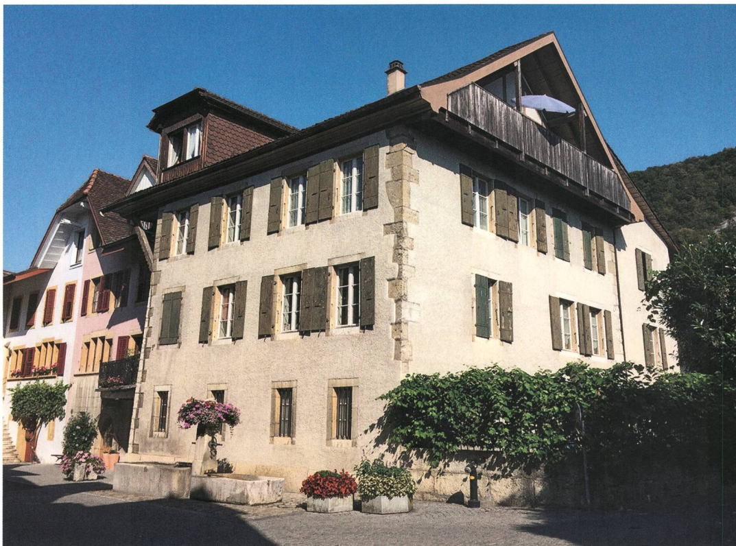
Fig. 2: La Neuveville, Rue du Faubourg 27. Le bâtiment avant sa transformation. Vue vers le nord-ouest.

sement équarris et posés sur un dallage préparatoire en léger ressaut, chargé de stabiliser la fondation. La première assise atteint 68 cm de hauteur, la seconde 66 cm, alors que les blocs les plus gros mesurent jusqu'à 112 cm de longueur. Le même mode de construction a été appliqué en façade sud, sur toute la hauteur du rez-de-chaussée. Ceci conférerait au bâtiment une impression de « maison forte », renforcée par sa position dominante en tête de rue. La date de 1621 taillée sur le portail du cellier renvoie sans doute à la construction du bâtiment. En revanche, sa hauteur originelle n'est pas connue. En façade est, on note la présence de deux séries de trois corbeaux en calcaire qui se rapportaient probablement à des appentis en bois appuyés contre la maison.