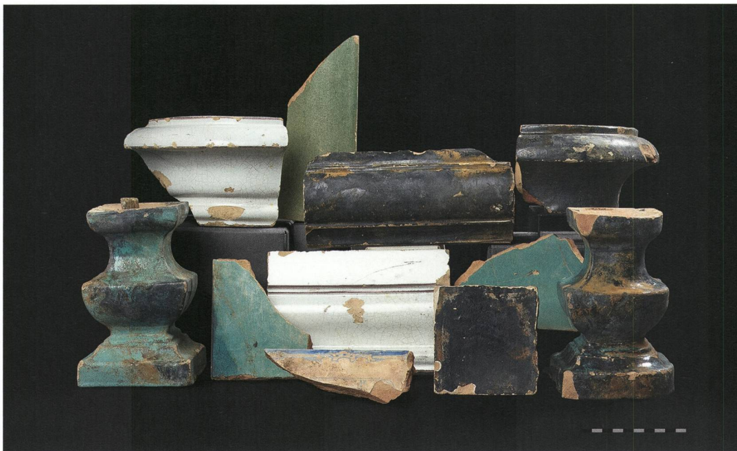
Fig. 6 : La Neuveville, Rue du Faubourg 27. Quelques carreaux de poêle provenant du comblement de la fosse cuvelée. Ces pièces datées du dernier tiers du 18 e siècle témoignent du confort du bâtiment avant sa transformation en locatif, vers 1900.

cuvelage en bois d'environ 150 × 200 cm, comblé avec de la démolition comportant de nombreux carreaux de poêle, fut partiellement arraché. Des problèmes d'infiltration d'eau massive n'ont pas permis d'en réaliser un relevé précis. Par contre, quelques carreaux de poêle extraits du comblement de la structure donnent une idée des fourneaux qui équipaient le bâtiment avant sa transformation en logements, probablement vers 1900. Parmi les fragments collectés, on découvre douze catelles de corps lisses, majoritairement de couleur vert-turquoise, huit fragments de plinthe et de corniche, certains en faïence blanche ornée de filets violacés, et huit pieds balustres complets de couleur turquoise et noirâtre (fig. 6). Un fragment de corniche à moulure en cavet surmonté d'un quart-de-rond s'apparente aux productions du potier yverdonnois Jacob Ingold, dans le dernier quart du 18 e siècle (Kulling 2001, 19 et 78). Les pieds en balustre de style Louis XV renvoient à la même époque. Les fragments restent trop peu nombreux pour que l'on puisse juger de la qualité des équipements de chauffage, mais il est évident que ces éléments appartiennent à plusieurs fourneaux.