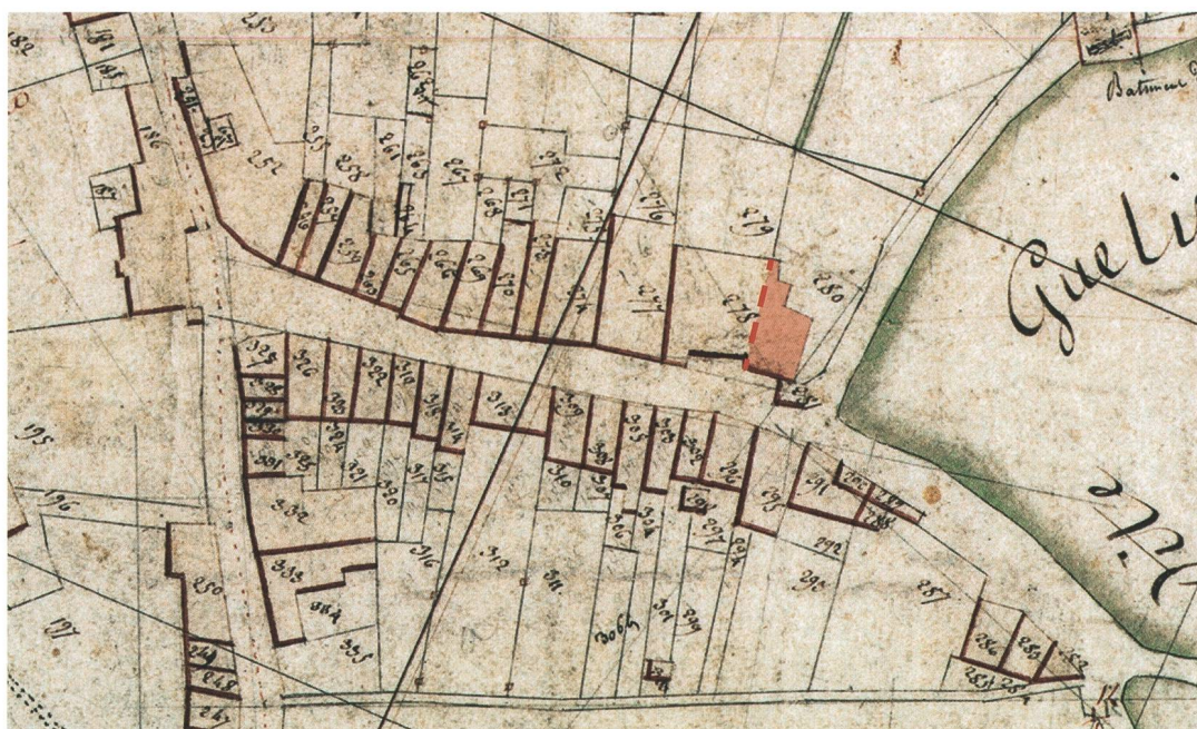
Fig. 1 : La Neuveville. Extrait du plan cadastral de 1813. En rouge, le n° 27 de la rue du Faubourg, en tireté l'ancien mur de façade observé. Éch. environ 1:1500.

À l'origine, cette façade orientale (fig. 5) n'était percée que par deux baies aux appuis saillants de facture distincte: celle du rez-de-chaussée éclairait peut-être le couloir d'entrée et celle du premier étage donnait sur le logement. La première, en calcaire blanc, présentait un appui chanfreiné aux angles biseautés; la seconde, en calcaire jaune d'Hauterive, disposait d'un appui orné d'un cavet entre deux filets. La base du mur est constituée de deux assises de gros blocs calcaires blancs soigneu-