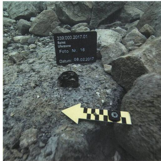
Abb. 3: Spiez, Schiffländte. Eichenpfahl aus dem Endneolithikum.

Dass die Siedlungsreste just an dieser Stelle auftauchten, ist kein Zufall. Der Befund liegt nämlich im An- und Ablegebereich grosser Kursschiffe, deren Schrauben starke Verwirbelungen auslösen, welche zu einer Seegrunderosion führen. Ohne die Einwirkung der Kursschiffe wären die Pfähle kaum ans Licht gekommen, denn entlang des westlichen Südufers wirken der natürliche Seegrund eher stabil, ten-