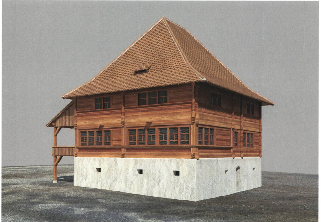
Abb. 2: Steffisburg, Oberdorfstrasse 32. Rekonstruktionsversuch zum Aussehen des Landhauses kurz nach seiner Erbauung 1543.

Nach mehrjährigem Leerstand beschloss die Eigentümerschaft, das Landhaus mit dem 1876–1878 angebauten Saal zu sanieren und einer neuen Nutzung zuzuführen. Eingerichtet wurde darin ein medizinisches Zentrum. Das Gebäudeensemble ist im kantonalen Bauinventar als schützenswert eingestuft und grundeigentümerverbindlich geschützt, weshalb die Kantonale Denkmalpflege zu einem frühen Zeitpunkt über die Planungsabsichten informiert wurde. Um zu verhindern, dass beim bevorstehenden Umbau aus Unkenntnis in verborgene, historisch wertvolle Bausubstanz eingegriffen wird, beschloss die Denkmalpflege, vorab eine umfassende Bauuntersuchung durchzuführen. Unterstützt wurde sie dabei vom Archäologischen Dienst des Kantons Bern, der dendrochronologische Analysen sowie Beobachtungen zum Mauerwerk und zum Dachstuhl durchführte und Teilbereiche zeichnerisch dokumentierte. Die weiteren Massnahmen, die Quellenrecherche, die Bauanalyse vor Ort, die fotografische Dokumentation und die Auswertung mit Bericht in Schrift und Plan, lagen bei der Denkmalpflege. Es ist dies ein Beispiel für die gelungene praxisgerechte Zusammenarbeit der beiden kantonalen Fachbehörden im Bereich einer umfangreichen Bauuntersuchung.