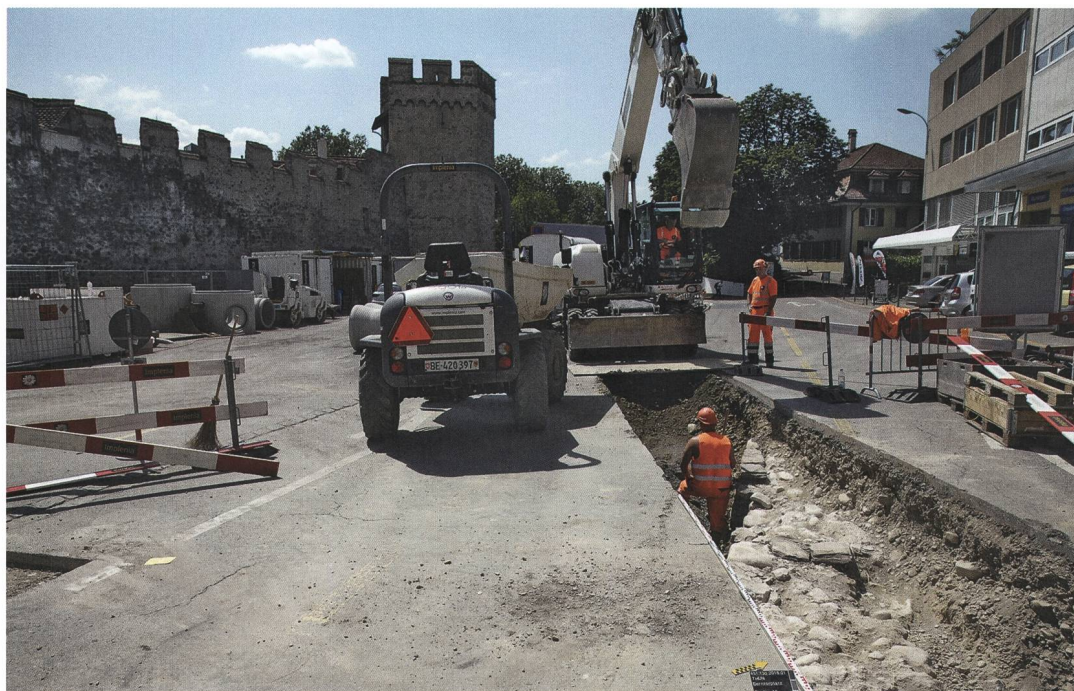
Abb. 1: Thun, Berntorplatz. Baugrube für die neue Gasleitung mit einem Abschnitt der äusseren Grabenmauer auf Höhe des Viehmarktplatzes im Sommer 2018. Blick nach Westen auf die Stadtmauer mit dem Venner-Zyroturm.

1947 war bei der Reparatur eines Gasleitungsbruchs erstmals ein gemauertes Joch der Brücke angeschnitten und dokumentiert worden. 1973 machte man Beobachtungen beim Bau des Parkhauses Grabengut. Zerstört wurde ein längerer Abschnitt der noch dicht unter der Grabenstrasse erhaltenen äusseren Grabenmauer. Benachbart waren an der damals abgebrochenen Knechtenhoferscheune noch Reste eines im Vorfeld des Grabens aufgeschütteten Vorwalls beobachtet worden, die aber undokumentiert blieben. 1974 legte man in der Unteren Hauptgasse erstmals die Fundamente des 1882 endgültig abgebrochenen Berntorturms frei. Sie springen gegenüber der Stadtmauerflucht bis