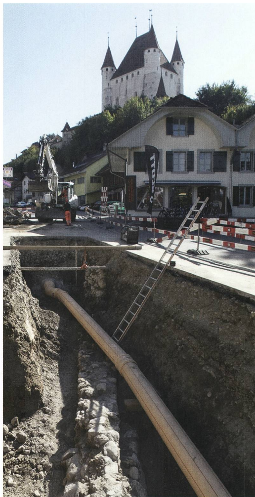
Abb. 3: Thun, Berntorplatz. Baugrube für den neuen Kanal mit einem Abschnitt der äusseren Grabenmauer vor dem Chutziturm im Herbst 2018. Blick nach Südosten mit dem Donjon der Burg.

jüngere Grabeneinbauten, wie der Römerkanal des 19. Jahrhunderts, der Abgang zu einem Pissoir im Graben des frühen 20. Jahrhunderts und die Kellermauern des Zollhauses von 1820, dokumentiert werden. Wichtig ist der erstmalige Nachweis der inneren Grabenmauer im Bereich des Eckgrundstücks Schwäbisgasse 6. Im Gegensatz zu allen übrigen Bauten entlang der Stadtmauer ist das heutige Gebäude ohne Keller geblieben, sodass sich die rund 5 m vor der Stadtmauer gelegene innere Futtermauer des Grabens erhalten konnte. Dieser Befund spricht für einen etwa 5 m breiten Geländestreifen, eine sogenannte Berme, zwischen Stadtmauer und Graben. Auch diesmal wurde Mauerwerk der wohl zweijochigen Berntorbrücke beobachtet. Ausbesserungen und Erneuerungen mit Backstein, wie sie auch zeitgenössische Quellen überliefern, sind zu belegen. Es ist möglich, dass ursprünglich nur Pfeiler zu einer hölzernen Fahrbahn bestanden haben, die erst sekundär über die Bögen miteinander verbun-