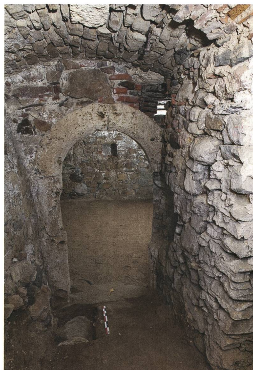
Abb. 6: Wiedlisbach, Städtli 29. Blick von Kellervorraum 02 in den frühneuzeitlichen Keller 01 der Zeit nach 1600. Blick nach Norden.

Gleichfalls wurde damals das Areal zwischen Stadtmauer und südlicher Gebäudefassade