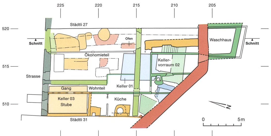
Abb. 4: Wiedlisbach, Städtli 29. Grundrissplan zum Erdgeschoss (fett) und zu den Kellern darunter (flau) mit den nachgewiesenen Bauetappen sowie den mittelalterlichen Gruben- und Schichtbefunden (flau). M. 1:250.

tensiv genutzter Bereich an. Die Brandwand über der westlichen Parzellengrenze geht im Kern ebenfalls auf das 15. Jahrhundert zurück (gelb). Kurz nach 1496 wurde ein Vorderhaus daran angebaut. Darauf weisen Dendrodaten zur östlichen Stubenwand hin. Die heutige Erschliessung des Wohnteils mit dem an der Ständerwand entlanggeführten Gang scheint bereits bestanden zu haben. Darunter liegt bis heute der zugehörige Vorderhauskeller, Keller 03 (Abb. 4, gelb, Abb. 5). Südlich grenzte die Küche mit der Herdstelle an. Dahinter könnten bis zur Stadtmauer ein kleiner Handwerksbereich und ein nicht überbauter Bereich bestanden haben.