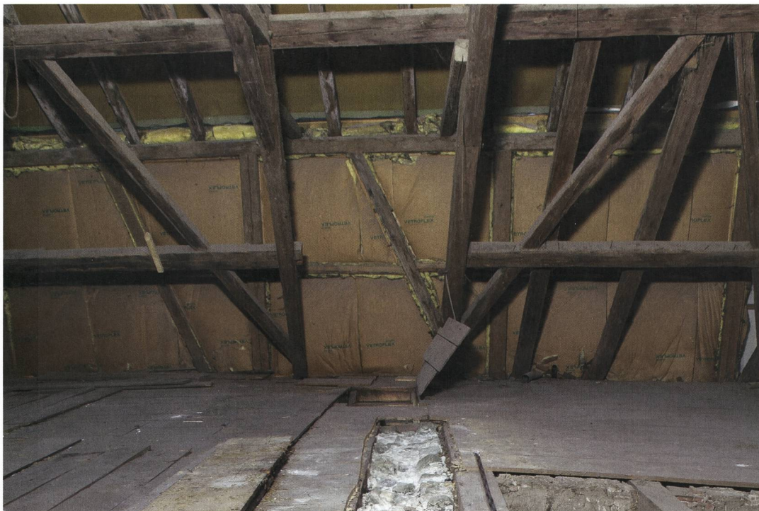
Abb. 7: Wiedlisbach, Städtli 29. Blick in das Dachgeschoss mit dem liegenden Dachstuhl von 1695/96d und der Trennwand zwischen Wohn- und Ökonomieteil. Blick nach Südosten.

überbaut (dunkelgrün). Die alte Südfassade wurde zum Teil abgebrochen, um die Räume bis zum Verlauf der ehemaligen Stadtmauer erweitern zu können. Auf allen Etagen fügte man neue Binnenwände in Riegkonstruktion ein. Spätestens jetzt wurde der Ökonomiebereich zur Tierhaltung und Lagerung von Heu verwendet. Ob auch zuvor eine landwirtschaftliche Nutzung bestanden hat oder aber Handwerker und Händler in der Liegenschaft wohnten, ist derzeit nicht zu entscheiden. Die Planierschicht über der Berme mit neuzeitlichen Hafnereiabfällen um 1770 bis 1800 scheint jedenfalls keinen Bezug zur Parzelle und deren Bewohner zu haben.