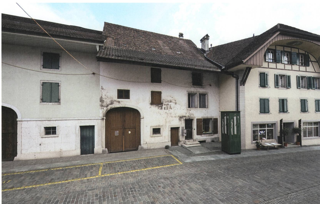
Abb. 1: Wiedlisbach, Städtli 29. Nordfassade von 1852. Blick nach Südwesten mit den Nachbarhäusern Städtli 27 (links) und Städtli 31 (rechts).

Erwähnt wird der Ort erstmals in Schriftquellen des Jahres 1275 als «Wietilspach» beziehungsweise «Wiechtilspach». Damit liegt ein gesicherter terminus ante quem für die Gründung der Stadt vor, die demnach unbestimmt lange zuvor entstanden sein muss. Da der Ort 1275 als oppidum bezeichnet wird, scheint er damals schon befestigt und wohl auch städtisch geprägt gewesen zu sein. Als Gründungsvater der Stadt gilt der Frohburger Graf Ludwig der Ältere (1212–1257/1259), der in der ersten Hälfte des 13. Jahrhunderts in der Region über grossen grundherrschaftlichen Einfluss verfügte.