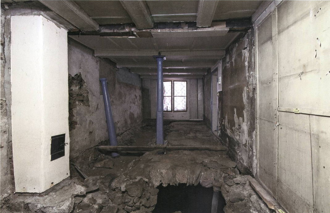
Abb. 5: Wiedlisbach, Städtli 29. Blick in die ehemalige Stube mit der unter dem Boden angechnittenen Gewölbetonne des strassenseitigen Steinkellers 03 der Zeit um 1500. Blick nach Norden.

Das Hinterhaus des 15. Jahrhunderts hat bis kurz nach 1600 existiert, bevor es durch den heutigen Keller 01 und ein darüber anzunehmendes Holz- oder Steinhaus abgelöst wurde (Abb. 4, blau, Abb.6). Das neue Hinterhaus war nun von der Stadtmauer abgerückt. Westlich davon, im bislang nicht überbauten Bereich, könnte nun ein laubenförmiger Aufgang zu den Obergeschossen entstanden sein.