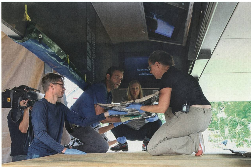
Abb. 7: Moosseedorf, Strandbad. Während des Einlegens in die Vitrine galt es, das fragile Objekt vor allen Beschädigungen zu schützen.

Während der Bauphase der Vitrine ermittelte und bewertete ein Konservatorenteam Risiken, 6 die bei einer frei zugänglichen Präsentation am Fundort entstehen (Abb. 6). Das grösste kurzfristige Risiko für den Einbaum besteht beim Transport und Einlegen in die Vitrine. Um dieses zu minimieren, wurde ein Schutzzelt gegen Witterungs- und Lichteinflüsse errichtet und ein Probelauf ohne das Originalstück inszeniert. Diese Massnahme trug massgeblich zu einem komplikationsfreien Einlegen des Boots in der Vitrine bei (Abb. 7). Mögliche langfristige Schäden, hervorgerufen durch unzureichenden Licht- oder Klimaschutz, werden durch kontinuierliches Monitoring überwacht.