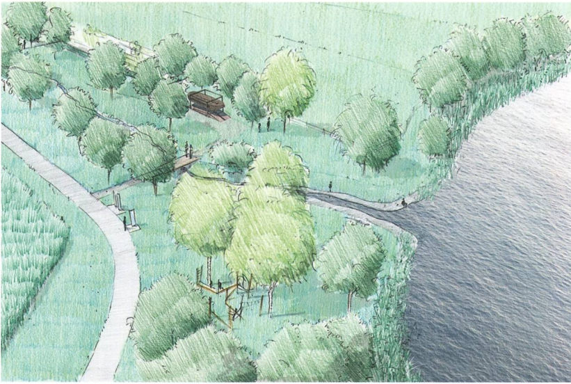
Abb. 10: Moosseedorf, Strandbad. Visualisierung «Pärkli am See». Das Projekt nimmt in den Köpfen der Planer Gestalt an.