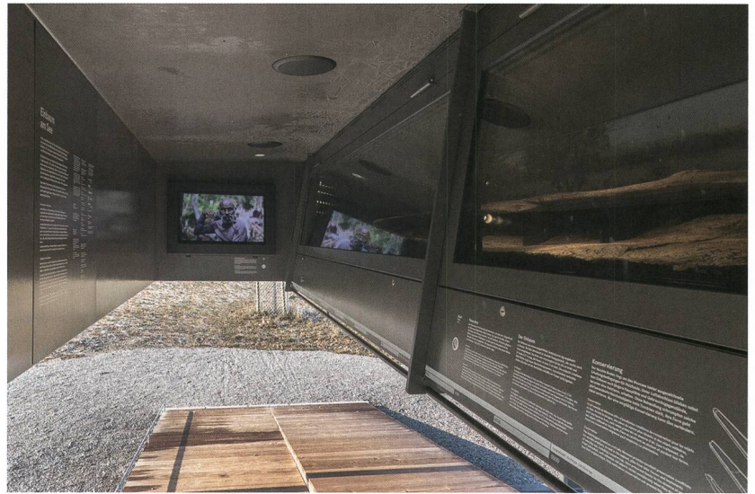
Abb. 12: Moosseedorf, Strandbad. Einblick in die Vitrine mit dem Einbaum (rechts) und dem Bildschirm im Hintergrund.

Auf einem Hintergrundbild ist eine stimmungsvolle Szenerie gemalt. Man sieht eine Seerandbesiedlung, Menschen auf einem Boot und bei der Arbeit, Tiere, die sie begleiten und Seevögel. Hypothetisch könnte es am Moossee vor tausenden von Jahren so zu- und hergegangen sein. Auf Knopfdruck ertönen Alltagsgeräusche – Vogelgeschrei, Wellenschläge, Hammer schläge von werkenden Menschen, Hundegebell. Alles wirkt ruhig und friedlich. Plötzlich rollt ein Donner. Auf dem Bild ist ein aufziehen-