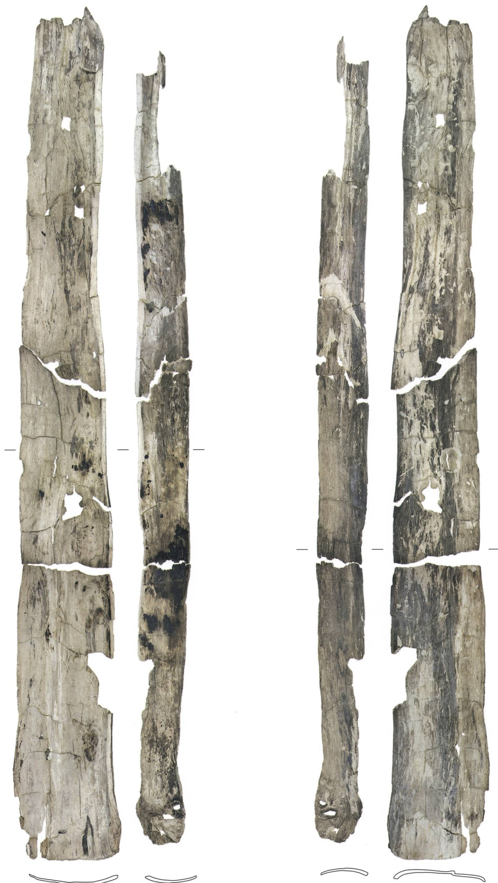
Abb. 3: Moosseedorf, Strandbad. Im konservierten Zustand sind im Bootsinnern (links) deutlich verbrannte Stellen zu erkennen. Sie könnten darauf hinweisen, dass der Lindenstamm mithilfe von Feuer ausgehöhlt wurde. Die Aussenseite (rechts) ist dunkler und stark erodiert oder verwittert. Das Boot lag vor seiner Einsedimentierung möglicherweise einige Zeit umgedreht am Strand. M. 1:25.