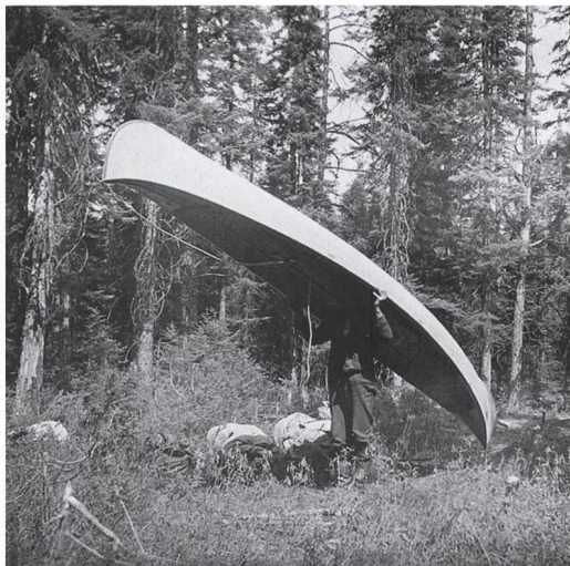
Abb. 11: Moosseedorf, Strandbad. Das Boot zum See tragen. Das Gestaltungskonzept soll vermitteln, dass die Besucher den weissen Bootsrumpf auf den Schultern tragen.

deutlich, dass neben der Position im Gelände die Präsentationsform ein entscheidender Faktor sein würde, um die Einzigartigkeit des Exponates hervorzuheben (Abb. 10). Wir schlugen deshalb von Beginn an eine solitäre, sprechende Installation vor. Diese kühne Projektidee verfolgten wir mit allen Beteiligten bis zum Schluss. Das Ergebnis ist eine skulpturale Vitrine, deren Form an ein aufgeständertes Boot erinnert. Der Besucher kann mit Kopf und Oberkörper von unten in den frei zugänglichen Ausstellungsraum mit Vitrine eintauchen. Der Projekttitle «Das Boot zurück an den See tragen» greift dieses Bild auf, die Besucher scheinen die Vitrine auf ihren Schultern zu tragen (Abb. 11). Der erzählerische Entwurf trug dazu bei, ein breites öffentliches Interesse zu gewinnen.