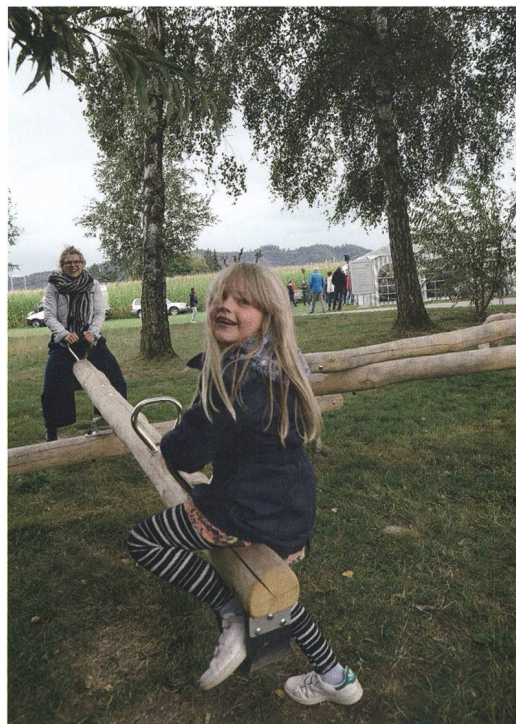
Abb. 9: Moosseedorf, Strandbad. Der neu gestaltete Spielplatz lockt kleine Besucher an.

Moosseedorf». Der Schritt über die Holzbrücke zum Kleinstmuseum bietet den grossen und kleinen Besucherinnen und Besuchern die Möglichkeit, sich die Landschaft und Lebenswelt der frühen Bewohner am Moossee vorzustellen. So kann das Verständnis für die Frühgeschichte dieser Gegend und die Erinnerung daran weiterleben (Abb. 8 und 9).