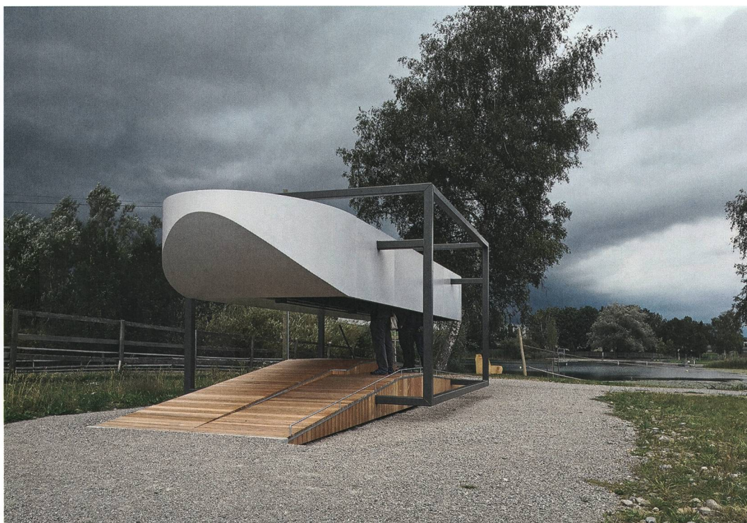
Abb. 1: Moosseedorf, Strandbad. Die neue Vitrine mit dem Einbaum hat ihren Platz unweit des Moossees gefunden.