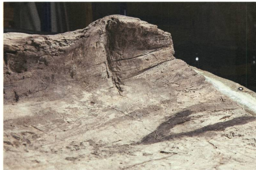
Abb. 2: Moosseedorf, Strandbad. Auf der Steuerbordseite des Hecks lässt sich eine mit dem Beil herausgeschlagene Kerbe erkennen, die vermutlich zum Einsetzen eines Heckbrettes diente.

Der Einbaum ist in seinem heutigen Zustand 5,77 m lang (Abb. 3), wobei das Heck vollständig erhalten ist und nur ein Stück der Bugspitze fehlt. Die Verjüngung des Bugs und der vordere Abschluss der Aushöhlung des Stamms sind aber klar erkennbar. Das Boot dürfte ursprünglich maximal 20 bis 30 cm länger gewesen sein. Die breiteste Stelle am Heck mass nur 48 cm, die Stärke des Bodens beträgt noch 2 bis 3 cm. Die Bordwände sind bis zu 35 cm hoch erhalten und, soweit messbar, an der dünnsten Stelle noch 1,2 cm, an der dicksten 4,5 cm dick.