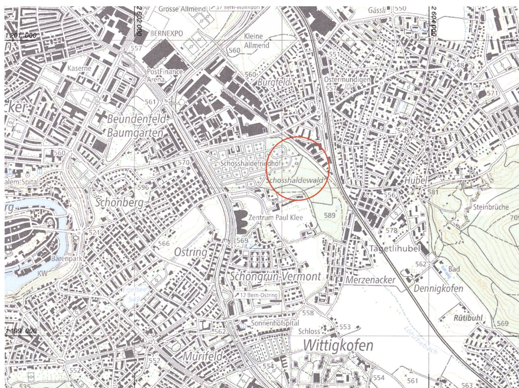
Abb. 1: Bern, Schosshaldewald. Im dicht überbauten östlichen Teil der Stadt Bern sind bislang nur wenige römische Fundstellen bekannt. Umso überraschender ist die Neuentdeckung in einem der letzten unüberbauten Gebiete (roter Kreis). M. 1:25 000.

Archäologisch war der Schosshaldewald bis vor Kurzem ein (beinahe) unbeschriebenes Blatt. Im Archäologischen Inventar war hier bis 2018 keine Fundstelle verzeichnet. Der Mülleratlas (1797–1799) und die Siegfriedkarte von 1880 zeigen, dass das Waldgebiet mindestens seit dem 18. Jahrhundert besteht. Für die Erweiterung des Schosshaldefriedhofs in den