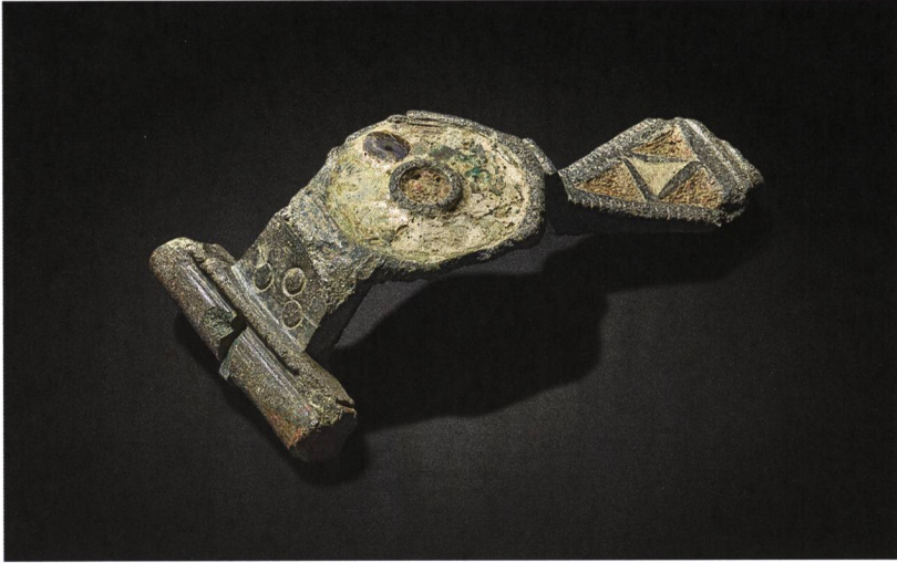
Abb. 4: Bern, Schosshaldewald. Bronzene Emailbügelfibel mit geteiltem Steg. M. 2:1.

befanden. Im äusseren Feld ist eine kreisrunde Fehlstelle erkennbar. Im tropfenförmigen Fuss der Fibel finden sich vier dreieckige Felder mit blauen und roten Emaileinlagen, oberhalb des Scharniers sind drei punktförmige Punzen angebracht. Dieser Fibeltyp erfreute sich ebenfalls im späteren 1. und insbesondere im 2. Jahrhundert grosser Beliebtheit.